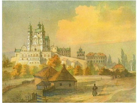
Т.Г. Шевченко Почаевская лавра

Один из родоначальников нашей прозы, драматургии и такого ныне популярного синтетического жанра, как эссе (вспомним его «Журнал»), обладающий незаурядными познаниями в философии, общественных науках, в антике, революционер по духу, делу и над всем этим гениальный поэт – вот истинный Шевченко.