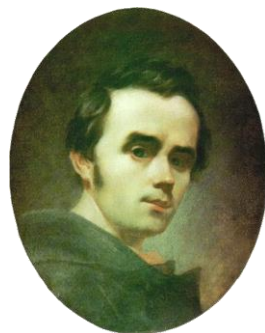
Тарас Шевченко Автопортрет, зима 1840-1841

Потребность в музыке была у него постоянной. Ей он посвящает самые пылкие записи в дневнике: «Божественный Гайдн! Божественная музыка!», «сыграл