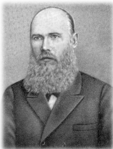
Павленков Флорентий Федорович