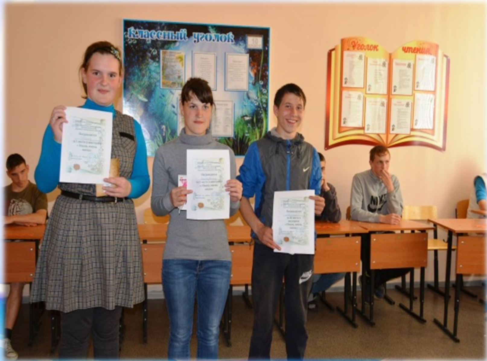
Награждение победителей викторины, посвященной Дню славянской письменности и культуры