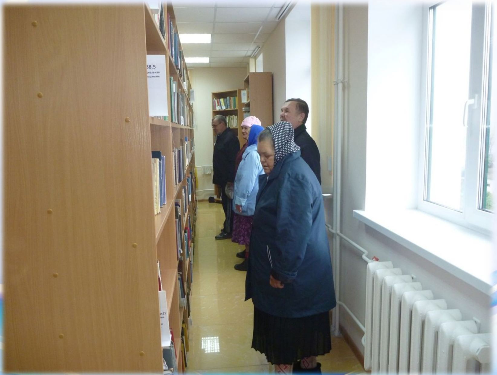
Экскурсия по центральной библиотеке для постояльцев Дома милосердия