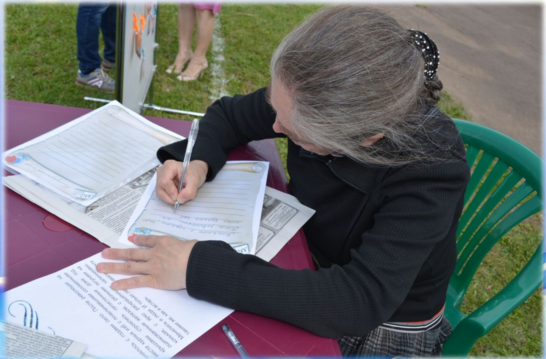
Участница конкурса «Самое читающее село»