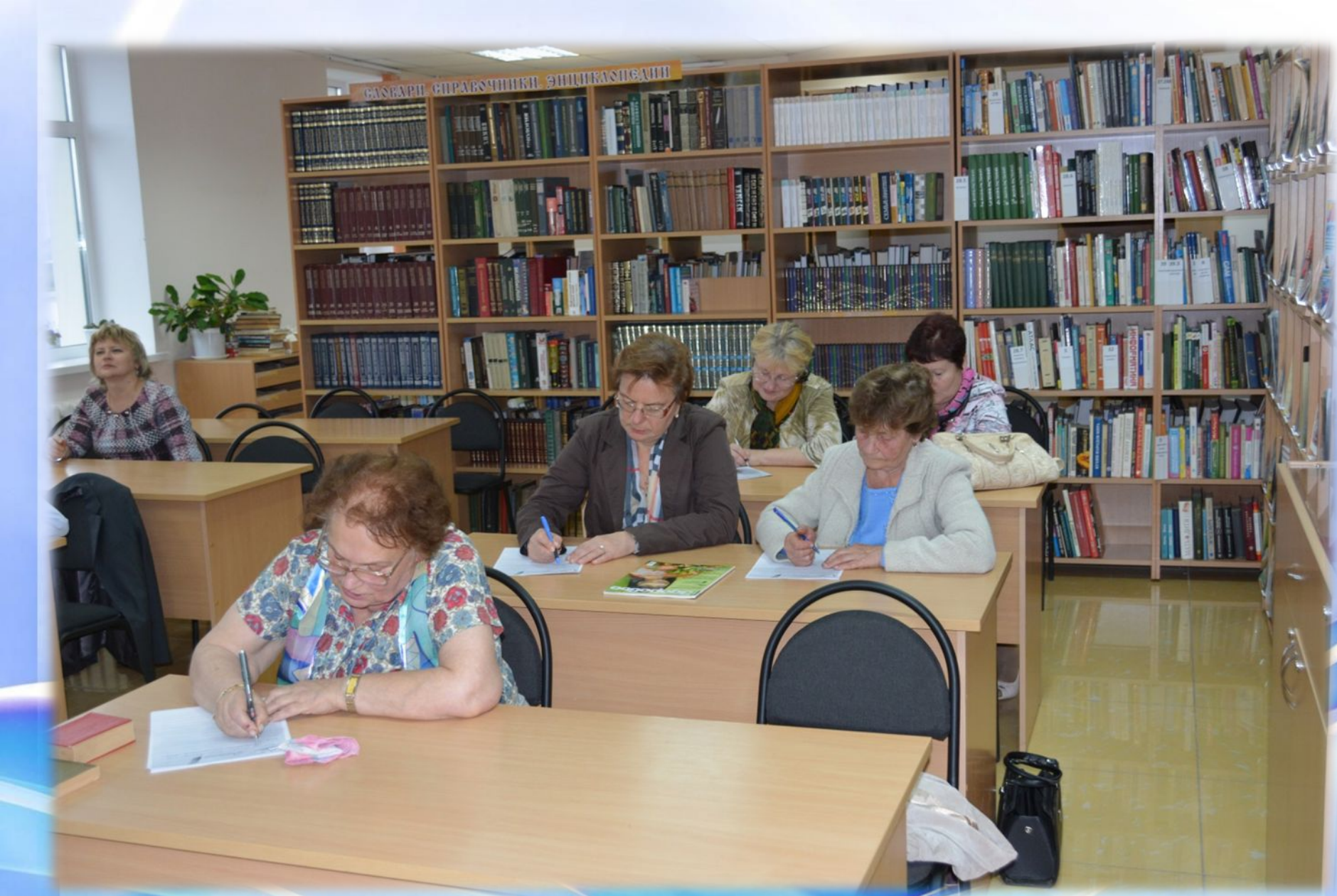
Конкурс на лучший каллиграфический почерк