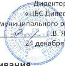
График сервисного обслуживания маломобильных групп населения (пенсионеры, инвалиды) филиал «Сатисская сельская библиотека»