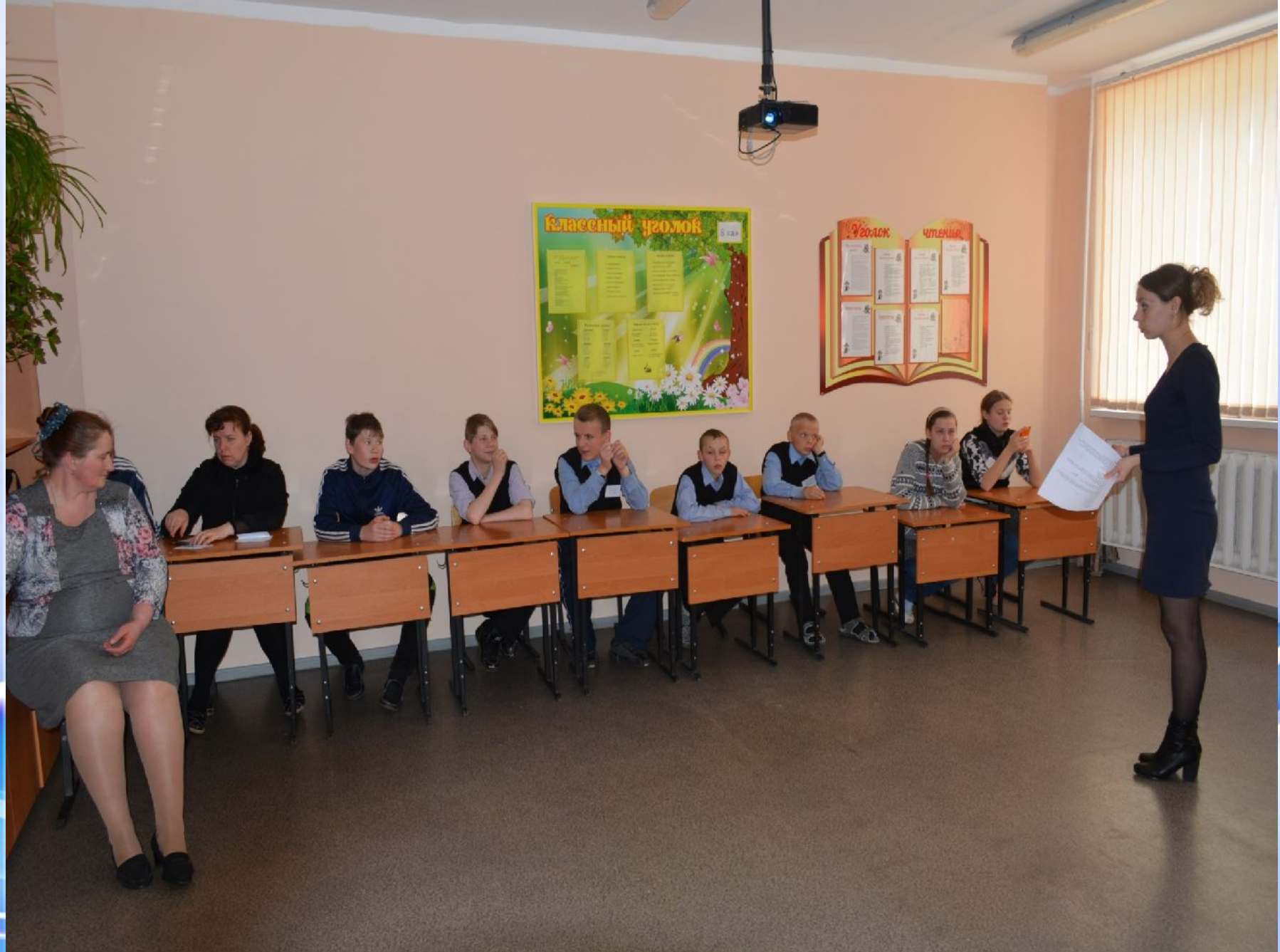
Мероприятие, посвященное Дню космонавтики