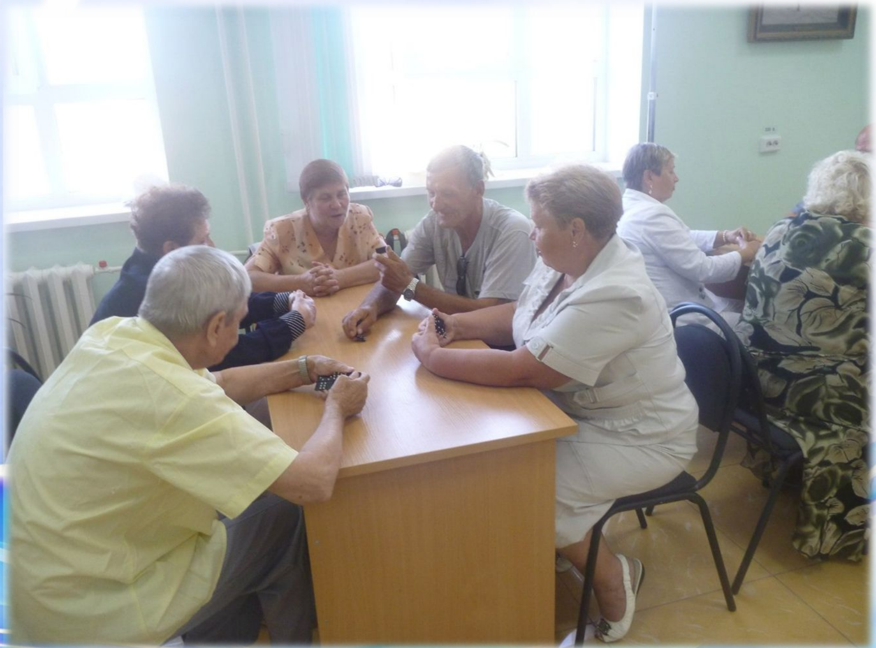
Сотрудничество с Советом ветеранов