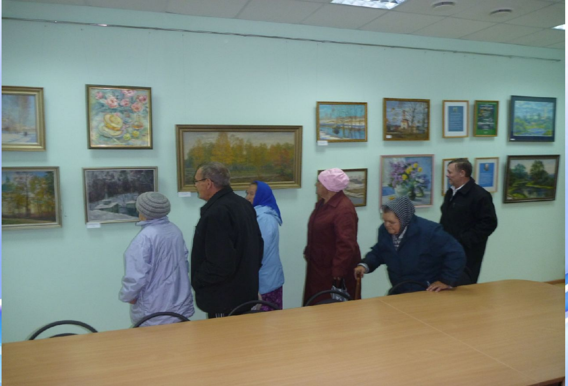
Жители дома милосердия на выставке в библиотеке