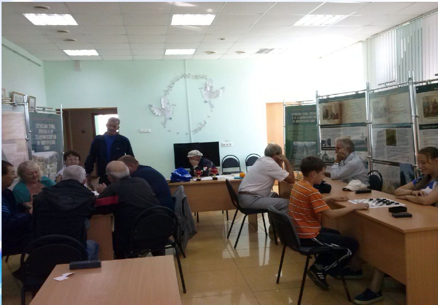
Сотрудничество с Домом милосердия. Шахматно-шашечный турнир, 2015 г.