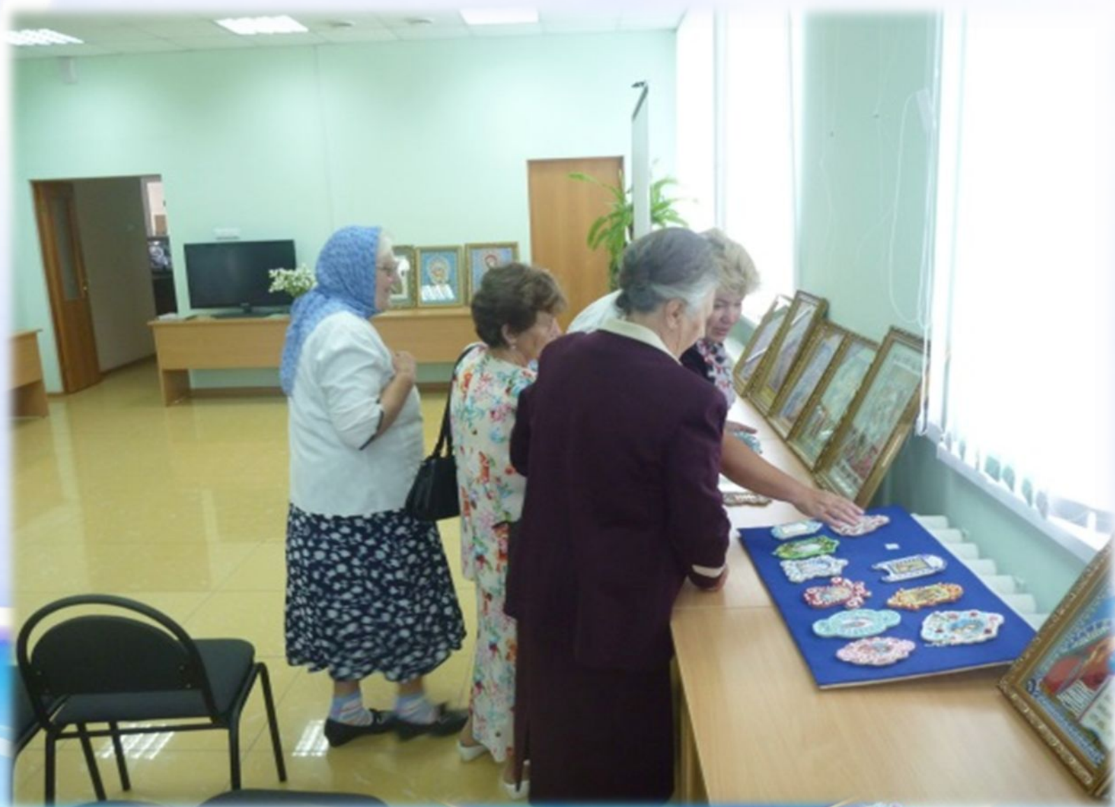
Выставка работ «Иконы из бисера»