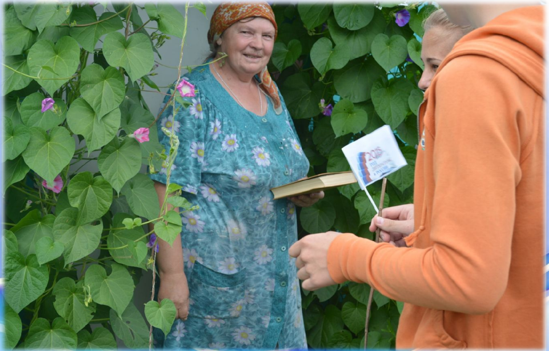
Обслуживание в отдаленных селах. Велопробег «Книга в пути»