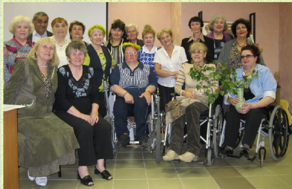
Общественная организация инвалидов Нижегородского района «Потенциал»

Нижегородская районная общественная организация Нижегородской областной общественной организации Всероссийского общества инвалидов