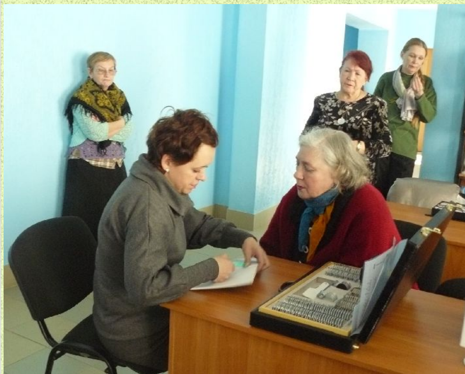
Консультации специалистов лечебных учреждений