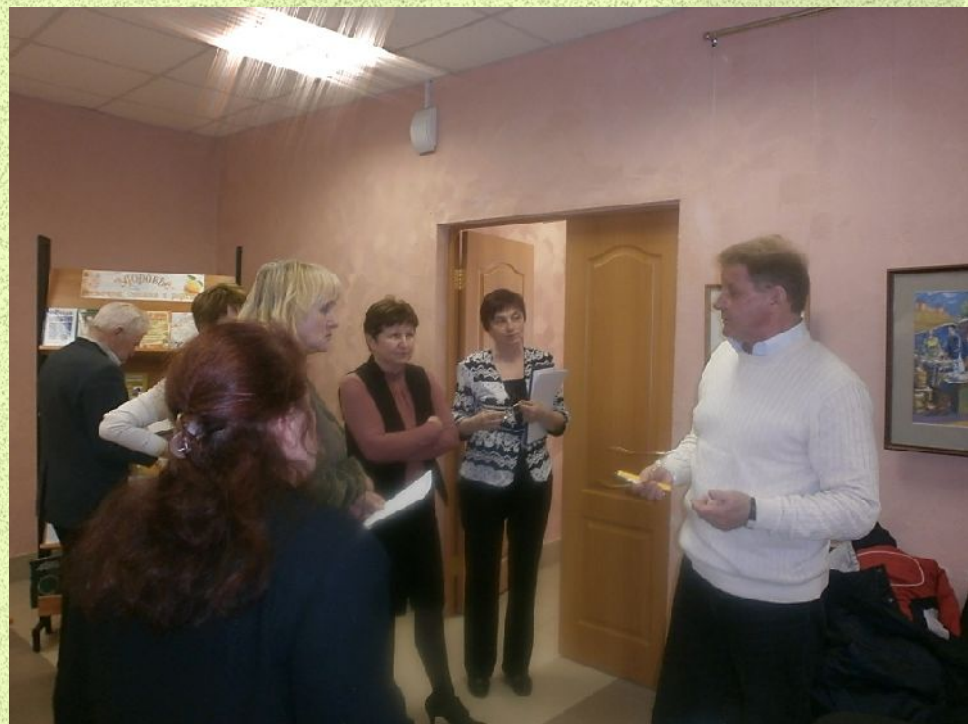
Встречи со специалистами Министерства здравоохранения Нижегородской области