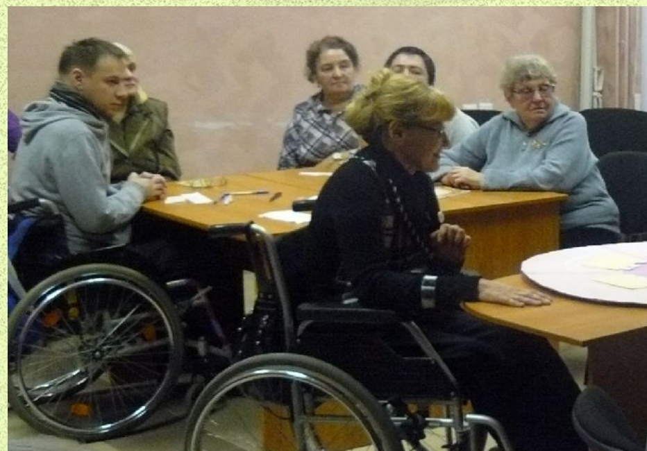
Команда общественной организации инвалидов Нижегородского района «Потенциал»