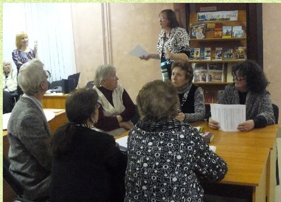
Команда Нижегородской районной общественной организации Всероссийского общества инвалидов