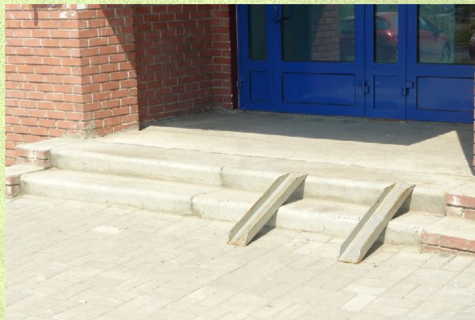
Пандус при входе в библиотеку