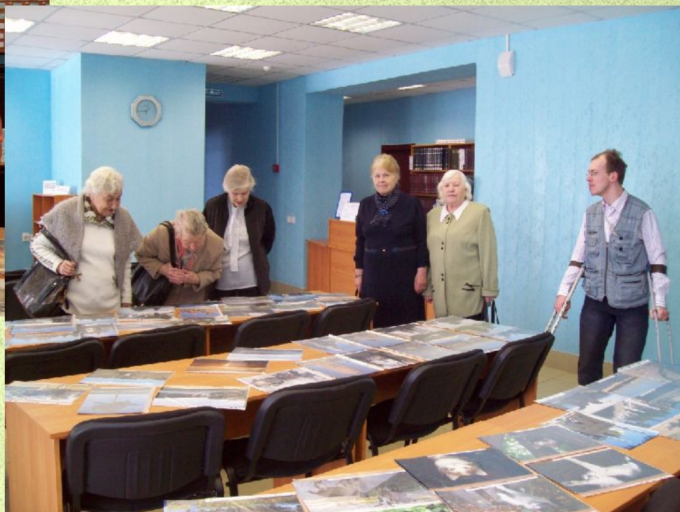
Фотовыставка «Мир глазами Александра Шаганина»