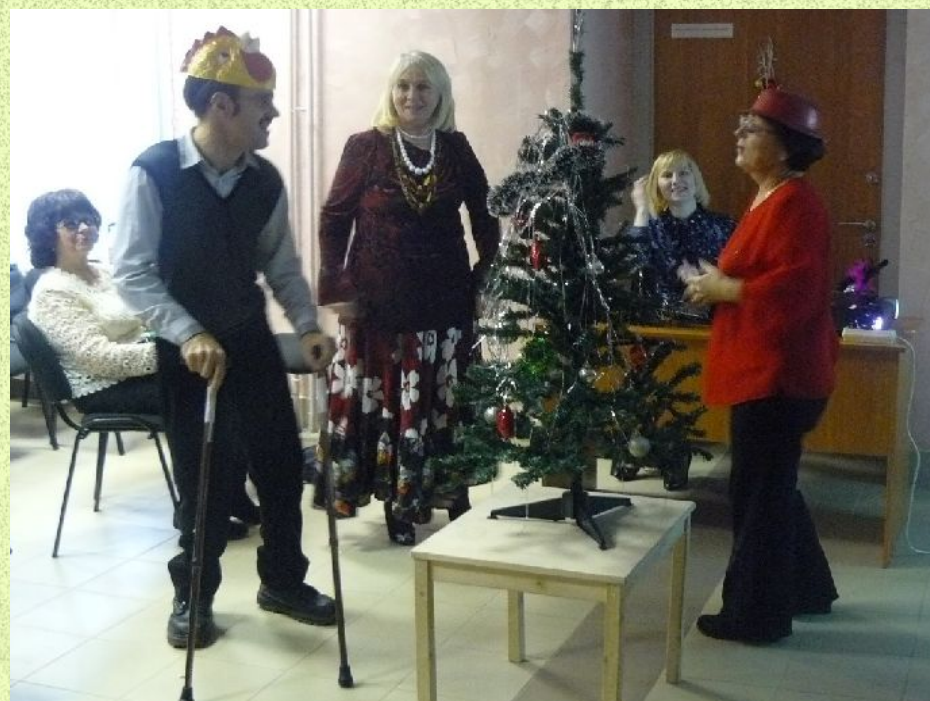
Старый Новый год

Общественная организация инвалидов Нижегородского района «Потенциал»