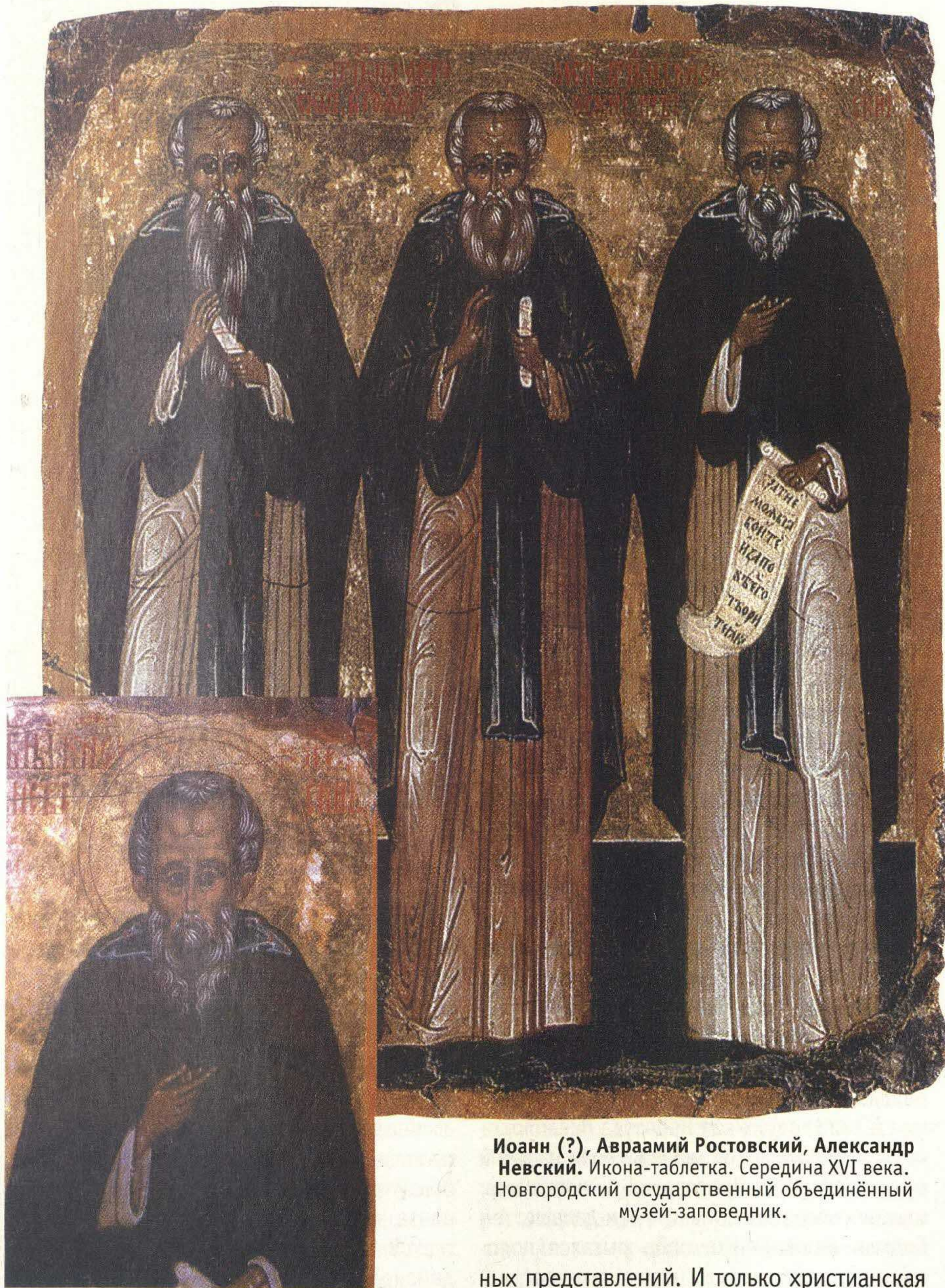
Иоанн (?), Авраамий Ростовский, Александр Невский. Икона-таблетка. Середина XVI века. Новгородский государственный объединённый музей-заповедник.

этих и других сообщений можно заключить о существовании княжеской власти в словенском обществе ещё до появления варягов».