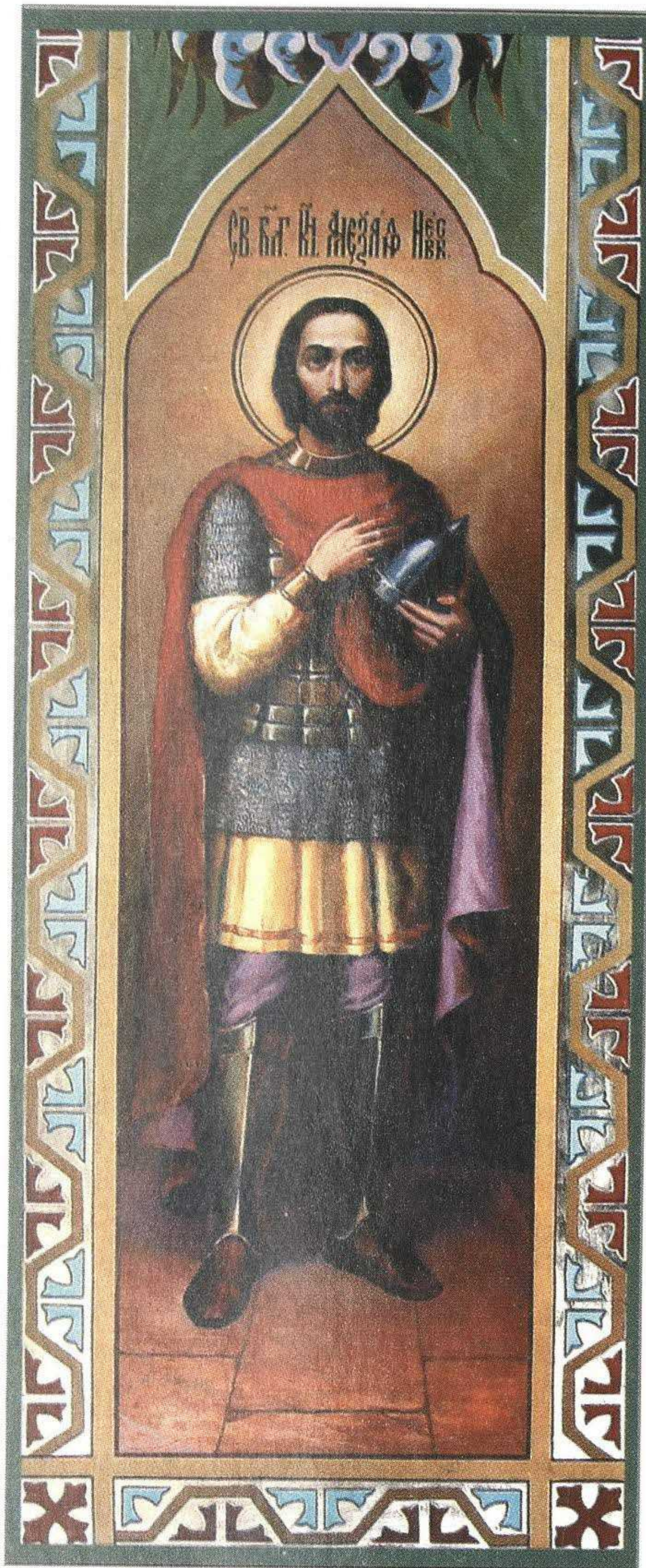
Святой Александр Невский. Конец XIX века, поновление в начале XXI века. Нижегородский Сергиевский храм.

Проблема была не только в том, что города были сожжены. Монголы уводили с собой лучших русских мастеров и ремесленников, а это, в свою очередь, приводило к тому, что затруднительно было торговать и строить. Даже в Великом Новгороде, который ордынцы не разрушали, на многие годы затормозилось каменное строительство. И великим делом князя Александра было сохранение этого города для Руси ради продолжения торговых и культурных отношений с Западной Европой. Его победы были важны не ради побед самих по себе и защиты границ, но и для обеспечения торговых преференций на новгородских условиях. «И прислали нем-