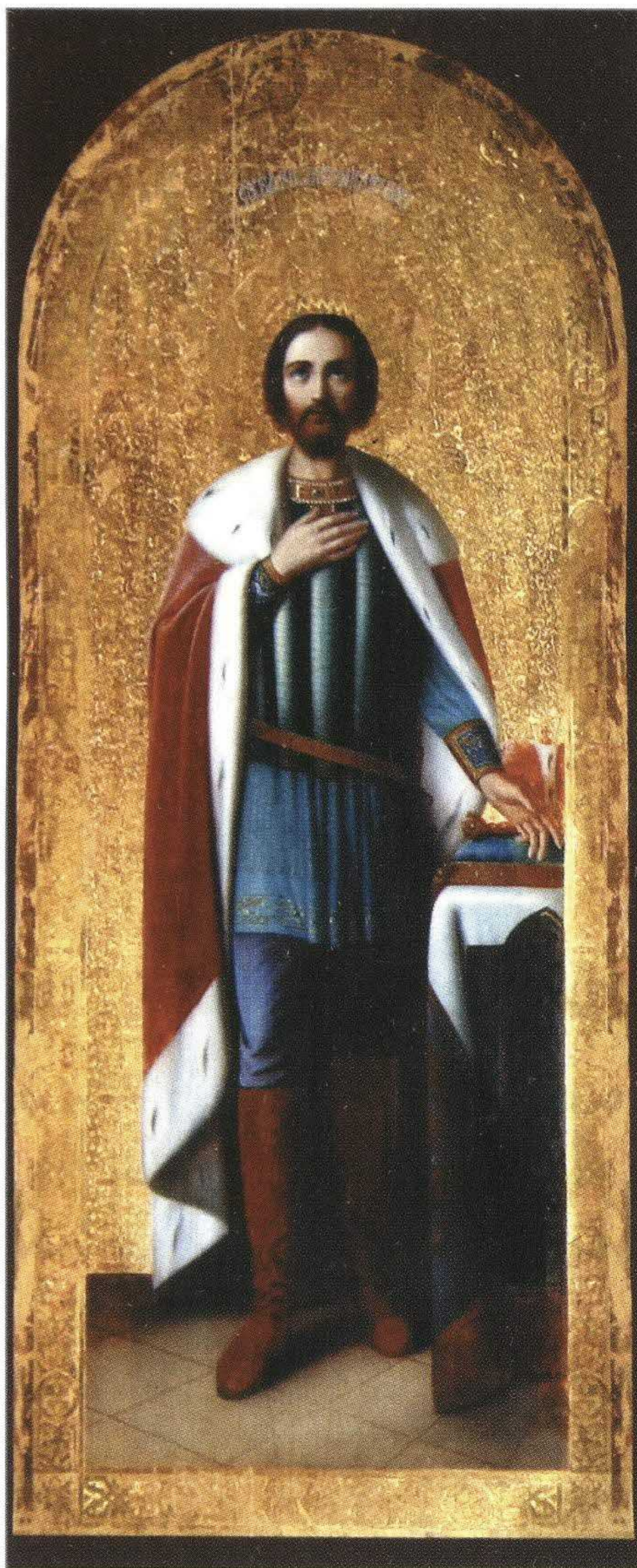
Святой Александр Невский. Конец XIX века. Нижегородский Александро-Невский собор.

Князь с дружиной нужен был Новгороду скорее как продолжение традиции, которая помогала чувствовать себя наравне с другими княжествами, и как защитник интересов, но он постоянно ущемлялся в правах. Новгородская I летопись рассказывает о призвании в 1228 году князя Ярослава Всеволодовича: «Поеди к нам... на всей воли нашей и на всех грамотех Ярославлих ты наш князь; или ты себе, а мы себе». И чем дальше, тем больше Великий Новгород пытался положить пределы князю в его политических и экономических притязаниях. Богатый город не хотел зависеть ни от киевского великого князя, ни от великих князей Владимиро-Суздальской Руси. Ему пришлось покориться Московской Руси, но своё значение он потерял всецело только тогда, когда на берегах Невы (за господство над которыми будет воевать ещё Александр Ярославич) Пётр I поставил новую столицу. Слава Великого Новгорода потускнела в силу потери им своего наиважнейшего значения как центра торго-