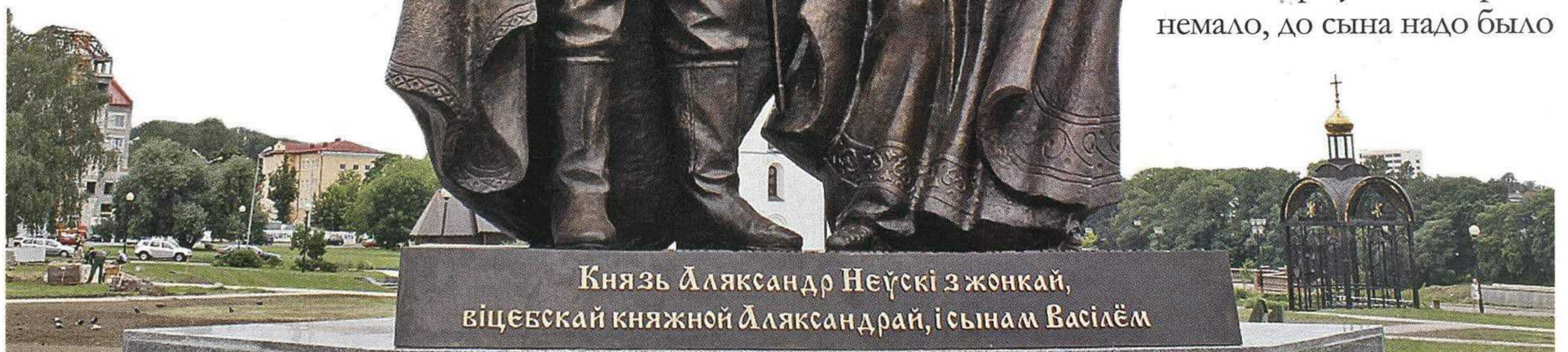
Князь Аляксандр Неўскі з жонкай, віцебскай княжнай Аляксандрай, і сынам Васіліем

Видимо, правило «построить дом, посадить дерево и вырастить сына» было в силе уже тогда, в XIII веке. Домов и крепостей к тому времени Александр уже построил немало, до сына надо было