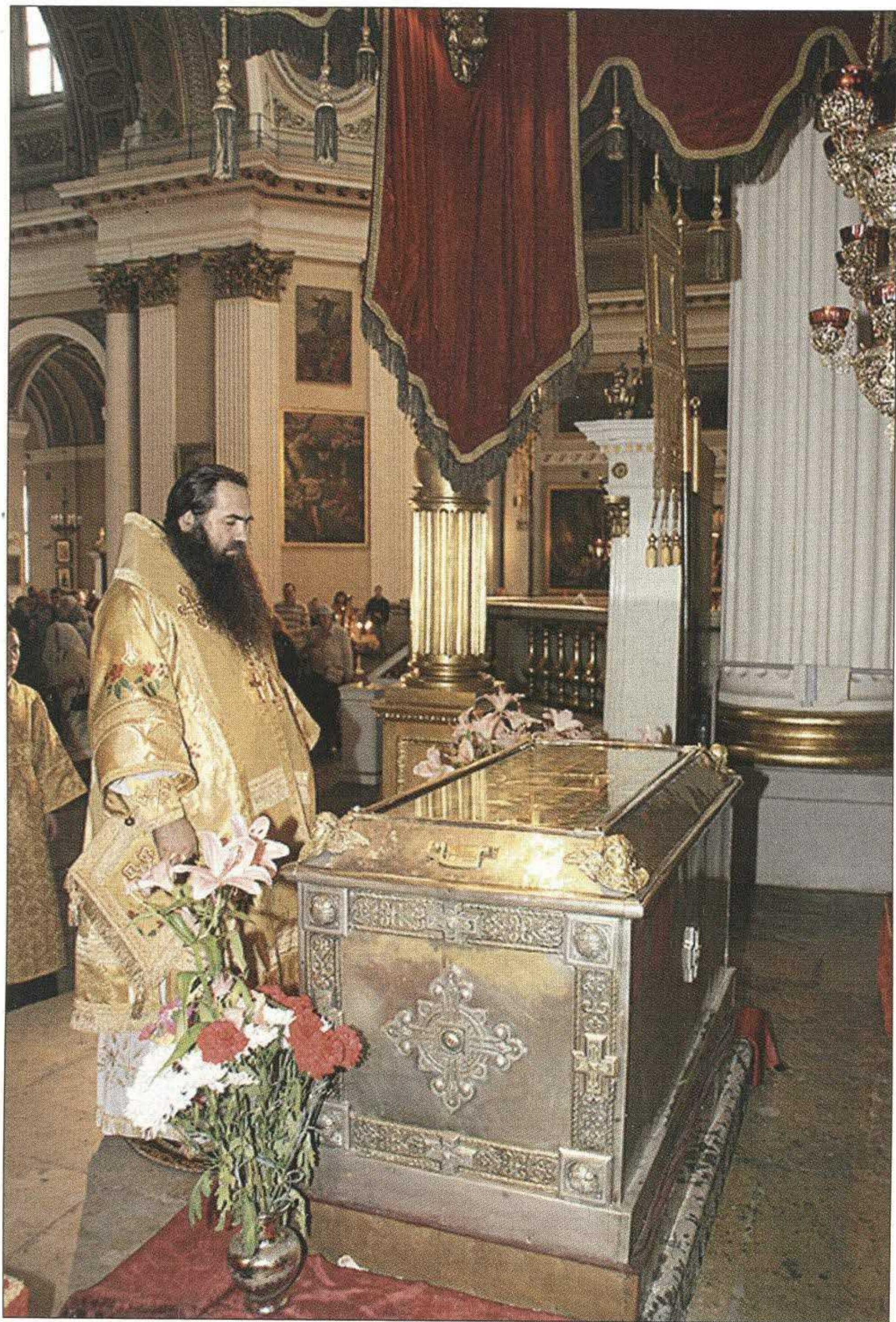
Рака с мощами Александра Невского в Свято-Троицком соборе Александро-Невской лавры в Санкт-Петербурге.

15 июля 1240 г. через 5 ч после рассвета, когда рыцари успели спокойно поесть, вооружиться, и шла до темноты, пока предводители не развели войска. Это было «правильное» сражение: конники многократно атаковали друг друга таранными ударами копий, отряды пехоты сменялись для отдыха, лучники и арбалетчики стреляли из укрытий.