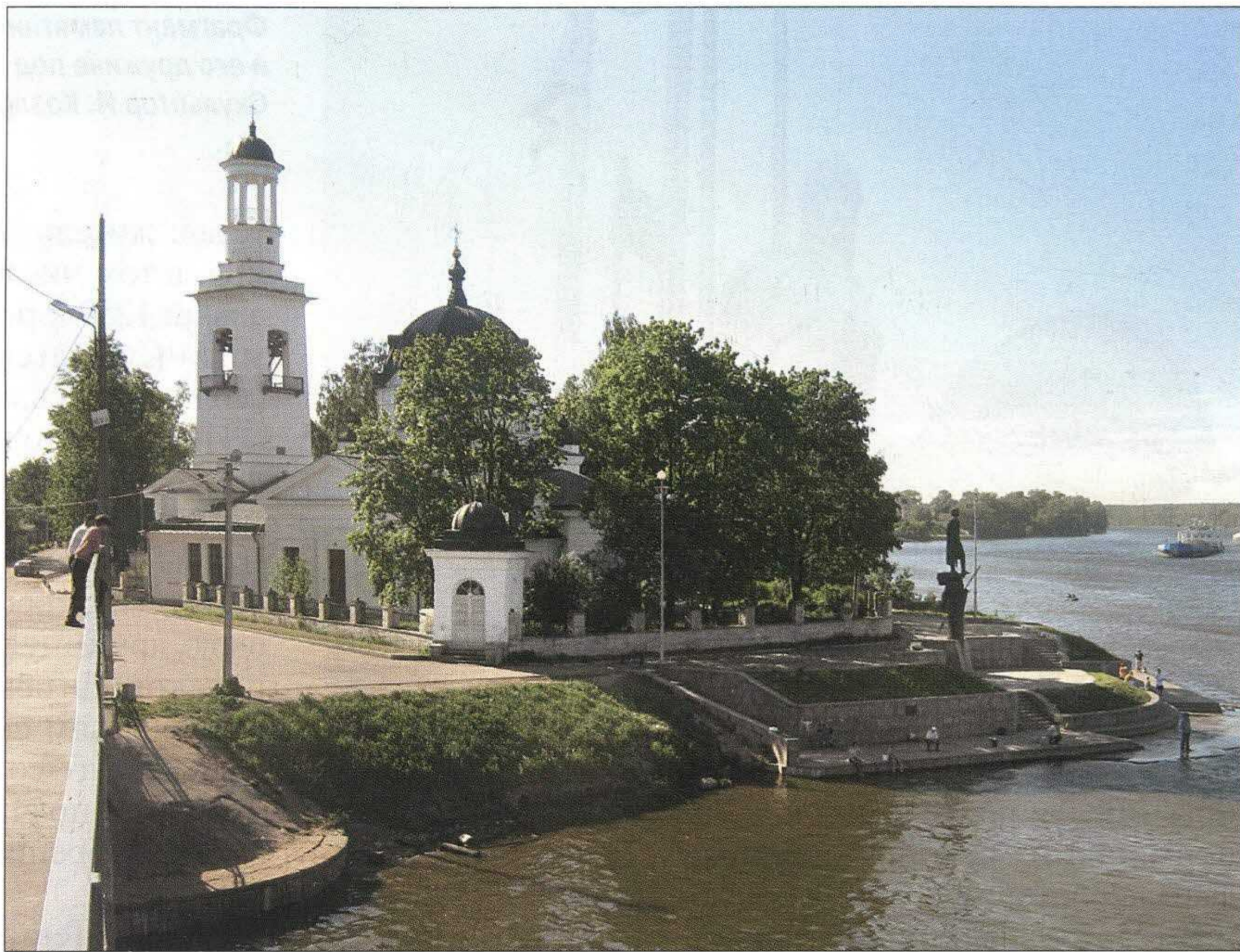
Церковь Александра Невского в Усть-Ижоре – историческом районе Санкт-Петербурга. Здесь 15 июля 1240 г. князь Александр Ярославич одержал победу над шведскими войсками, за что получил прозвище Невский.

по домам рыцарей, князь отложил боевые действия до тех пор, пока младший брат Андрей не приведет сюда отцовские полки. Только их вступление в город весной 1242 г. заставило власти республики собрать собственную рать. Но в поход Александр отправился только со своей и отцовской дружинами.