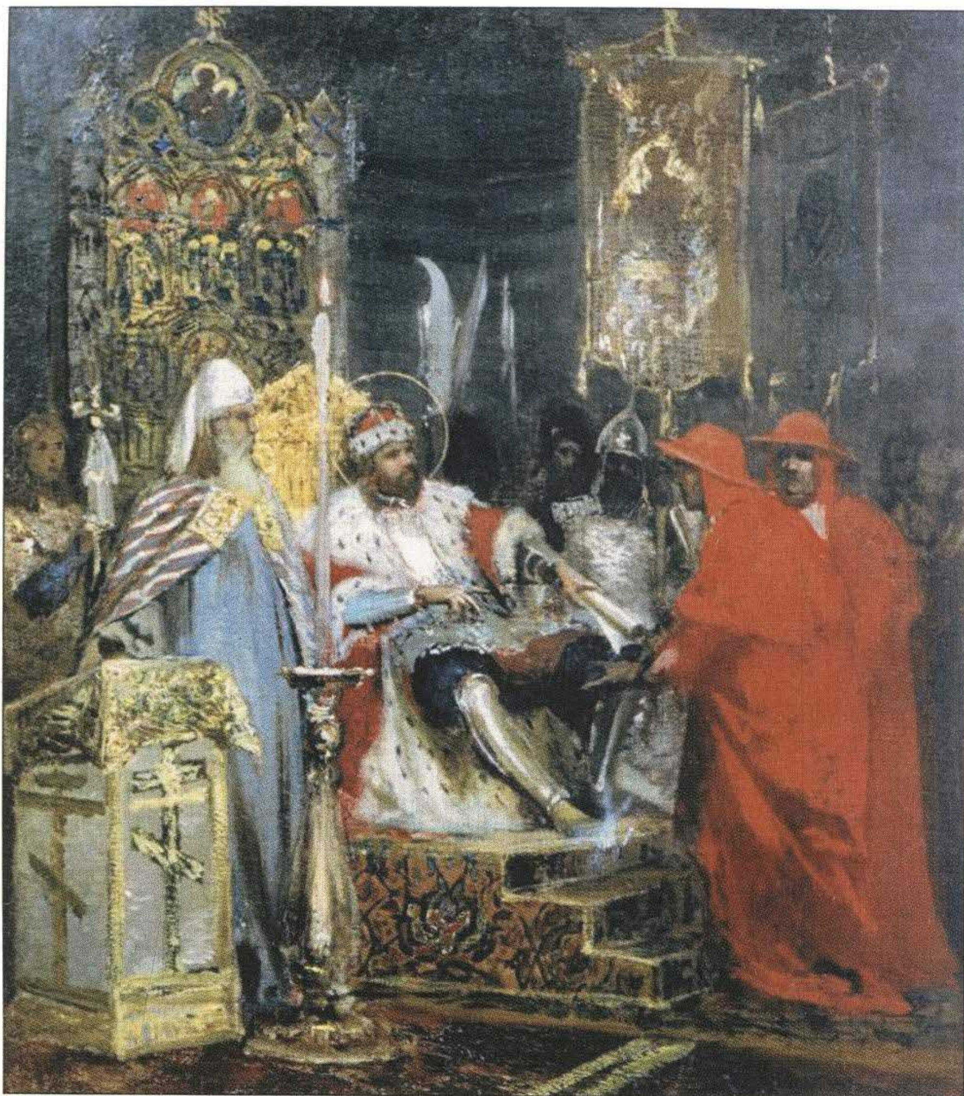
Князь Александр Невский принимает папских легатов. Художник Генрих Семирадский. 1876 г.

ской империи, не завоеванной варварами), а сформировавшейся в результате принятия христианства славянами и финно-уграми, издавна входившими в наше государство. А один из постулатов этой веры — недопустимость навязывания своей религии, обычаев, языка другим народам.