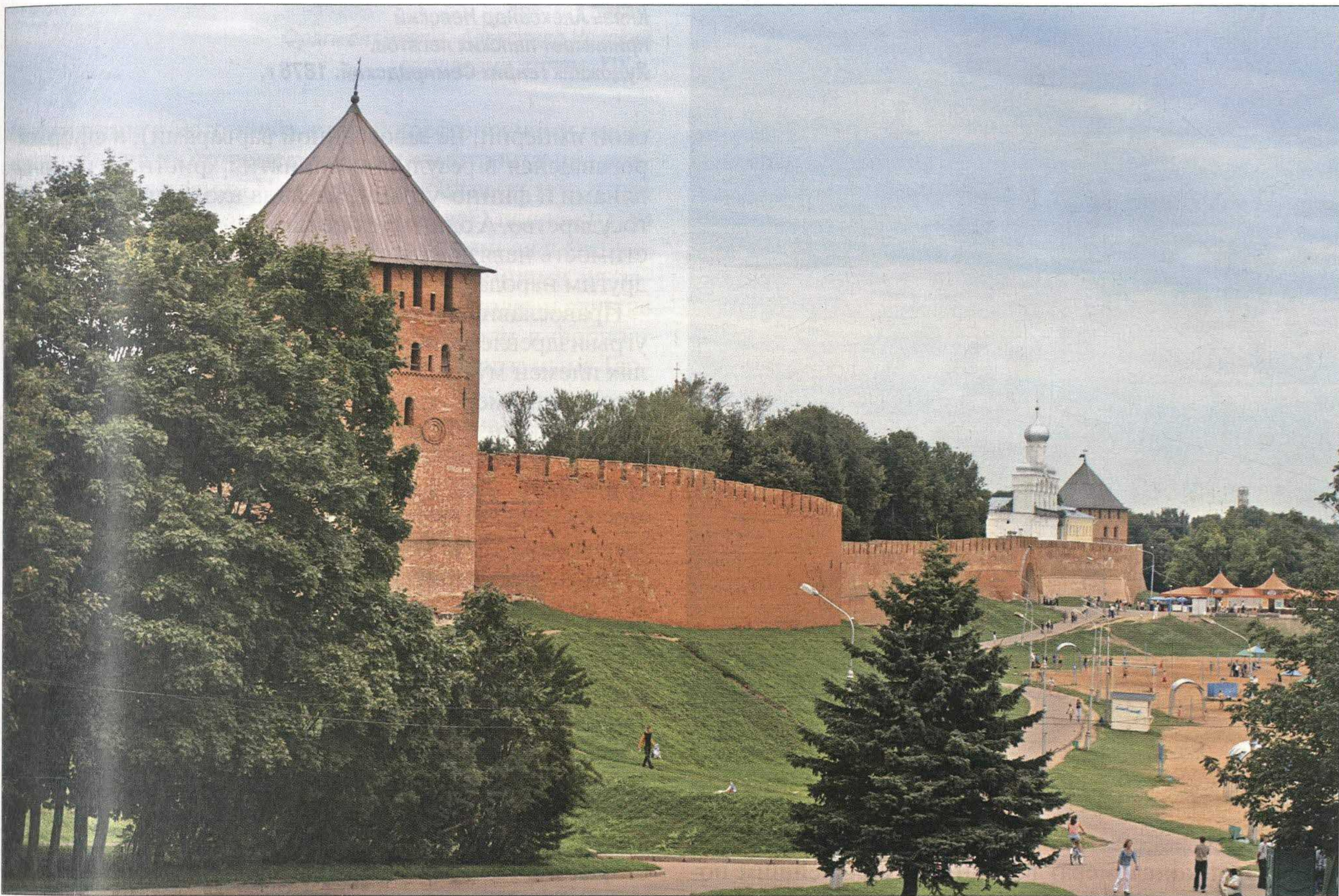
Кремль Великого Новгорода.