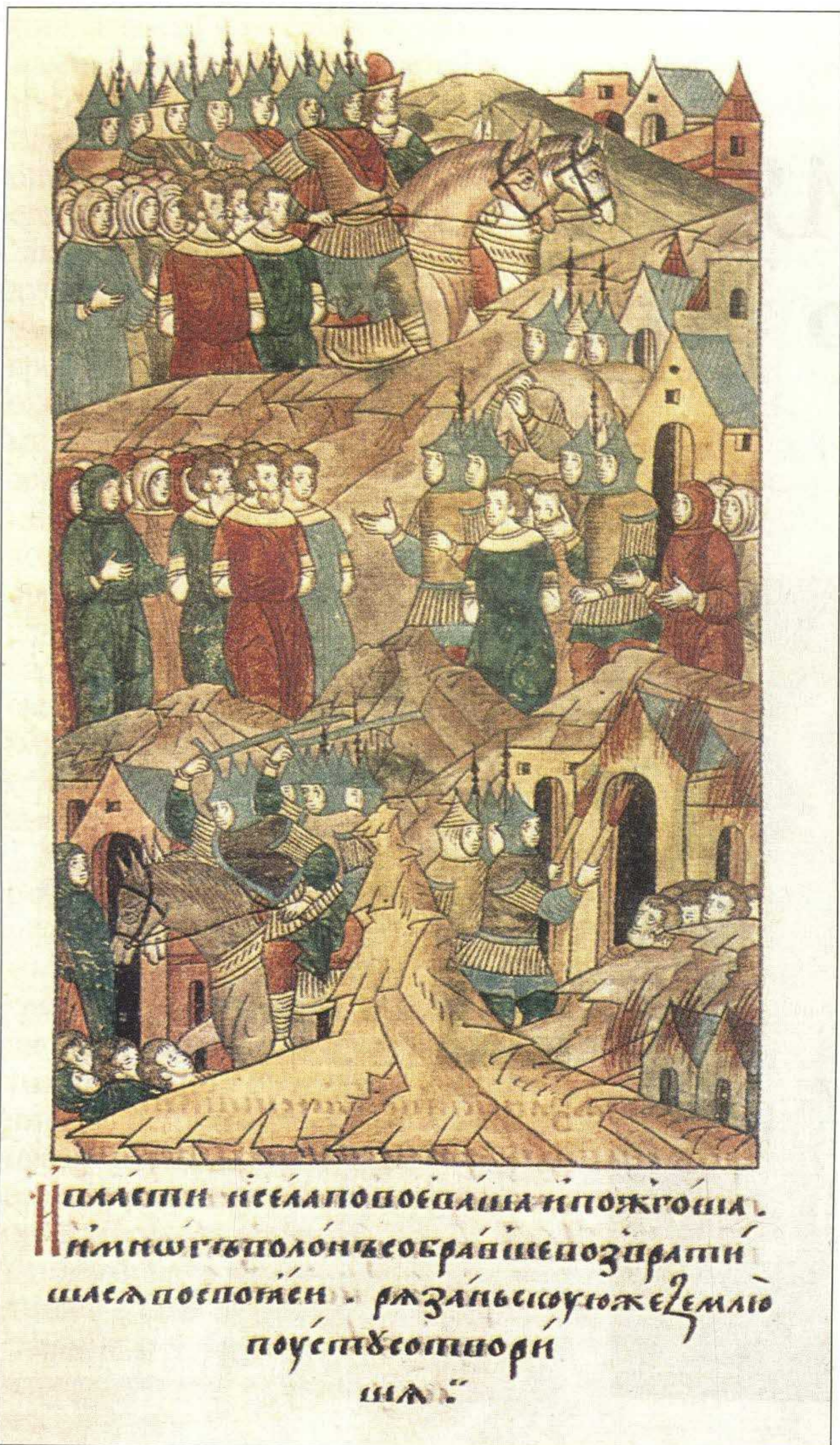
Разорение Рязани Батыем. Миниатюра из Лицевого летописного свода. XVI в.