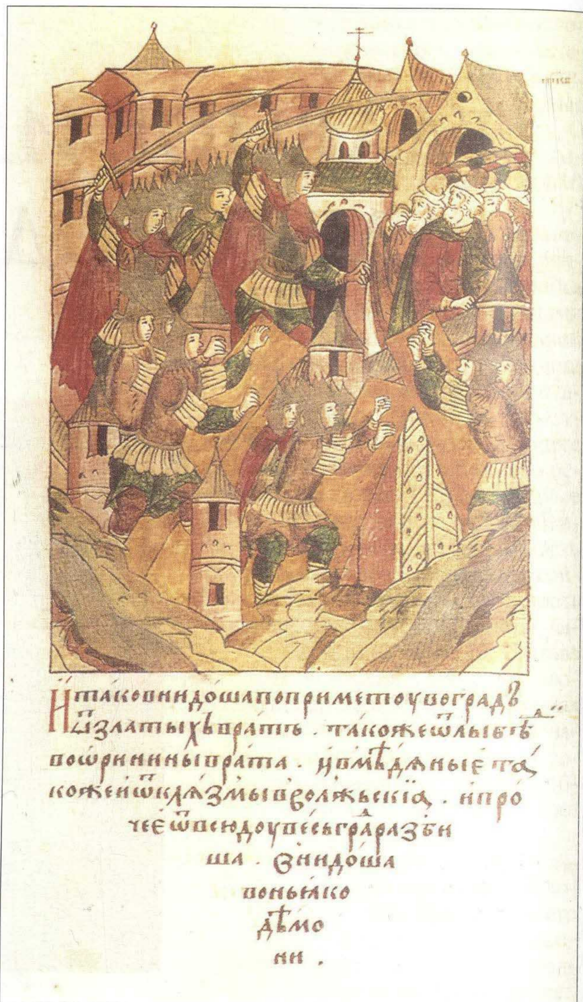
Взятие города Владимира Батыем. Миниатюра из Лицевого летописного свода. XVI в.

Величие этого человека, объявленного святым сразу после смерти, заключается в том, что он явил своей жизнью идеалы, взгляд на мир, до сих пор определяющие в самосознании народа. Его образ олицетворяет уверенность в возможности руководствоваться принципами справедливости и добра даже в самых сложных условиях, отрицает национальную или религиозную нетерпимость, утверждает идею открытости России во взаимодействии этносов и культур.