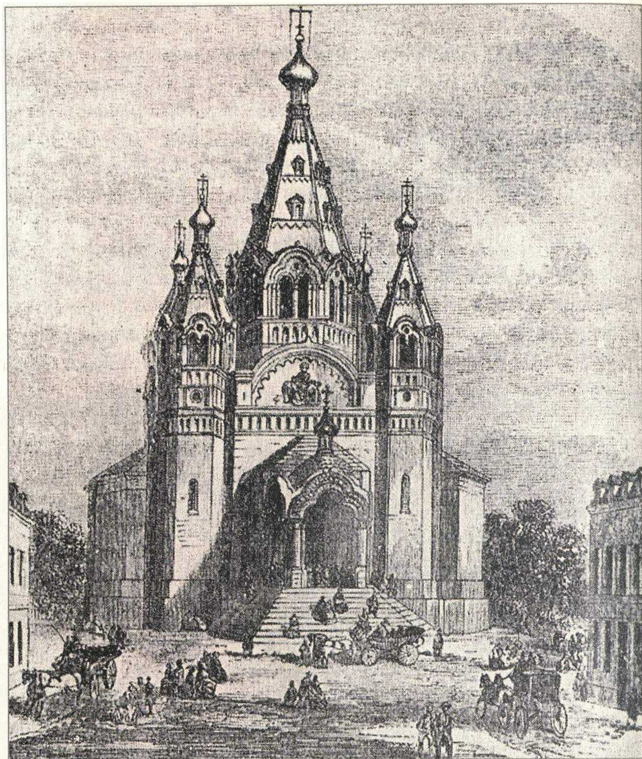
Свято-Александрo-Невский храм в год его основания.

В нашей публикации речь пойдёт об обстоятельствах возникновения этого первого очага русского православия на земле Франции 2 , как они отразились в документах, обнаруженных в фонде «Российское посольство в Париже 1801–1924 гг.» Архива внешней политики Российской империи.