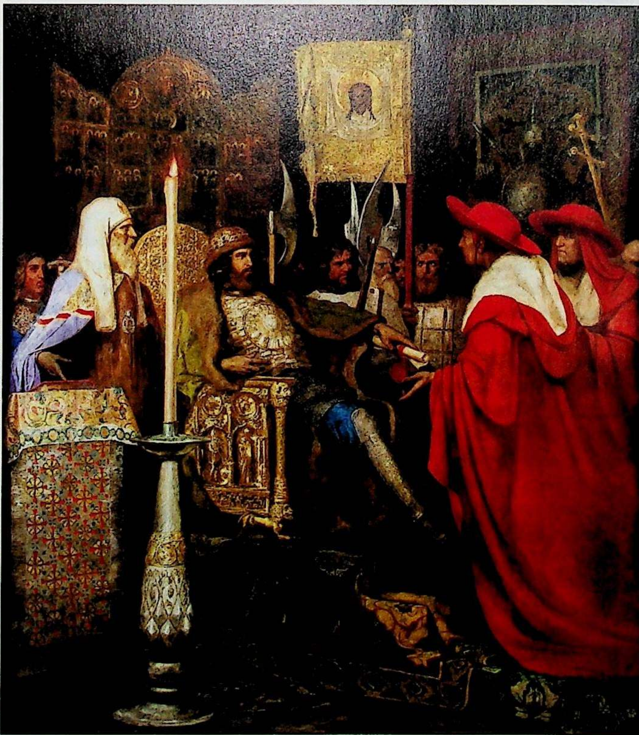
Г. СЕМИРАДСКИЙ. «АЛЕКСАНДР НЕВСКИЙ ПРИНИМАЕТ ПАПСКИХ ЛЕГАТОВ». 1876

Даниил Галицкий, напротив, заключил союз, признал папу «своим отцом» и за это получил от него корону и титул «короля Руси». В результате глава католиков объявил крестовый поход против татар и... русских. Тот начался в 1253 году при участии весьма характерной коалиции. На одном фланге ливон-