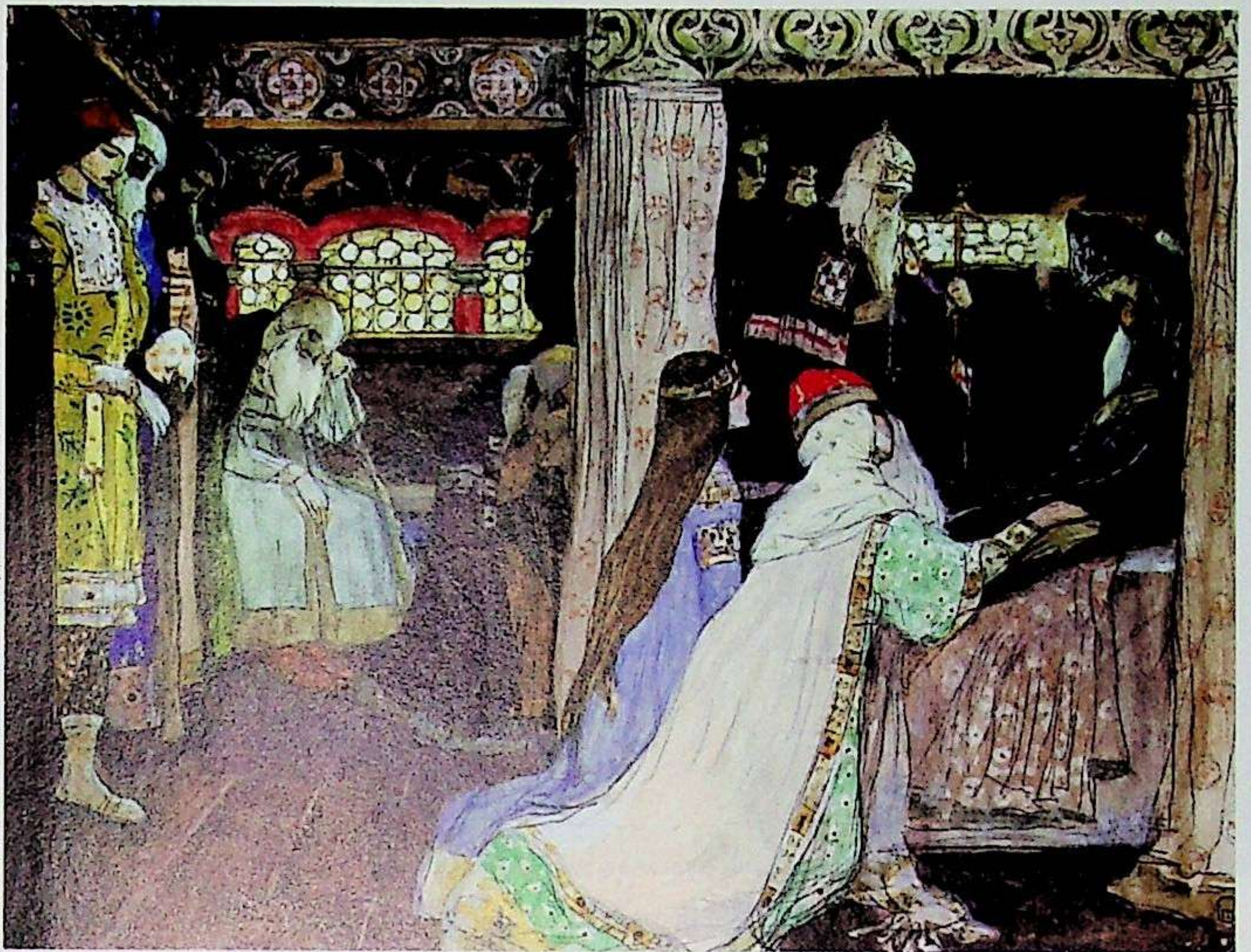
М. НЕСТЕРОВ. «КОНЧИНА АЛЕКСАНДРА НЕВСКОГО», 1900

Св. Александр Невский прославился многочисленными чудесами, исцелениями, приходил на помощь потомкам в трудных обстоятельствах. В 1380 году его мощи были найдены нетленными и перенесены в новую раку. Официальная канонизация князя осуществилась в 1547-м, при Иване Грозном. А в 1552-м, выступив в поход на Казань, царь молился возле мощей, и было явлено чудо, предвестившее победу. В 1571-м, во время нашествия крымских татар на Москву, во Владимире монахи видели: от раки будто поднялась и взмыла к небу фигура князя. Крымский хан в тот же день полу-