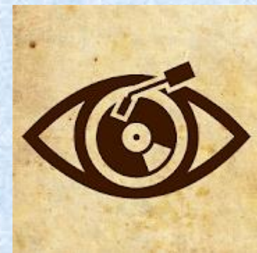
PhonoPaper – запись и чтение звука на бумаге