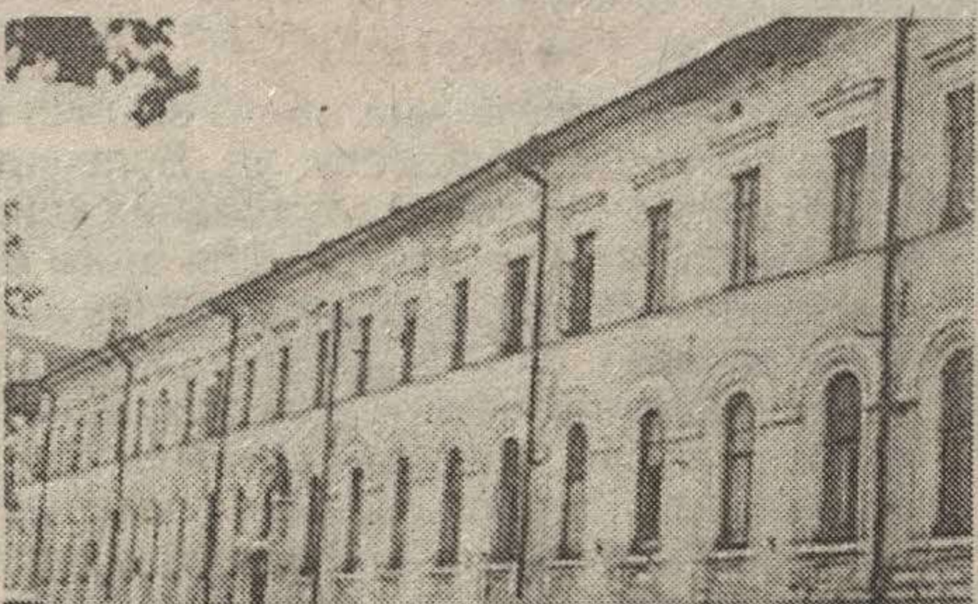
Алексеевский корпус (пл. Минина)