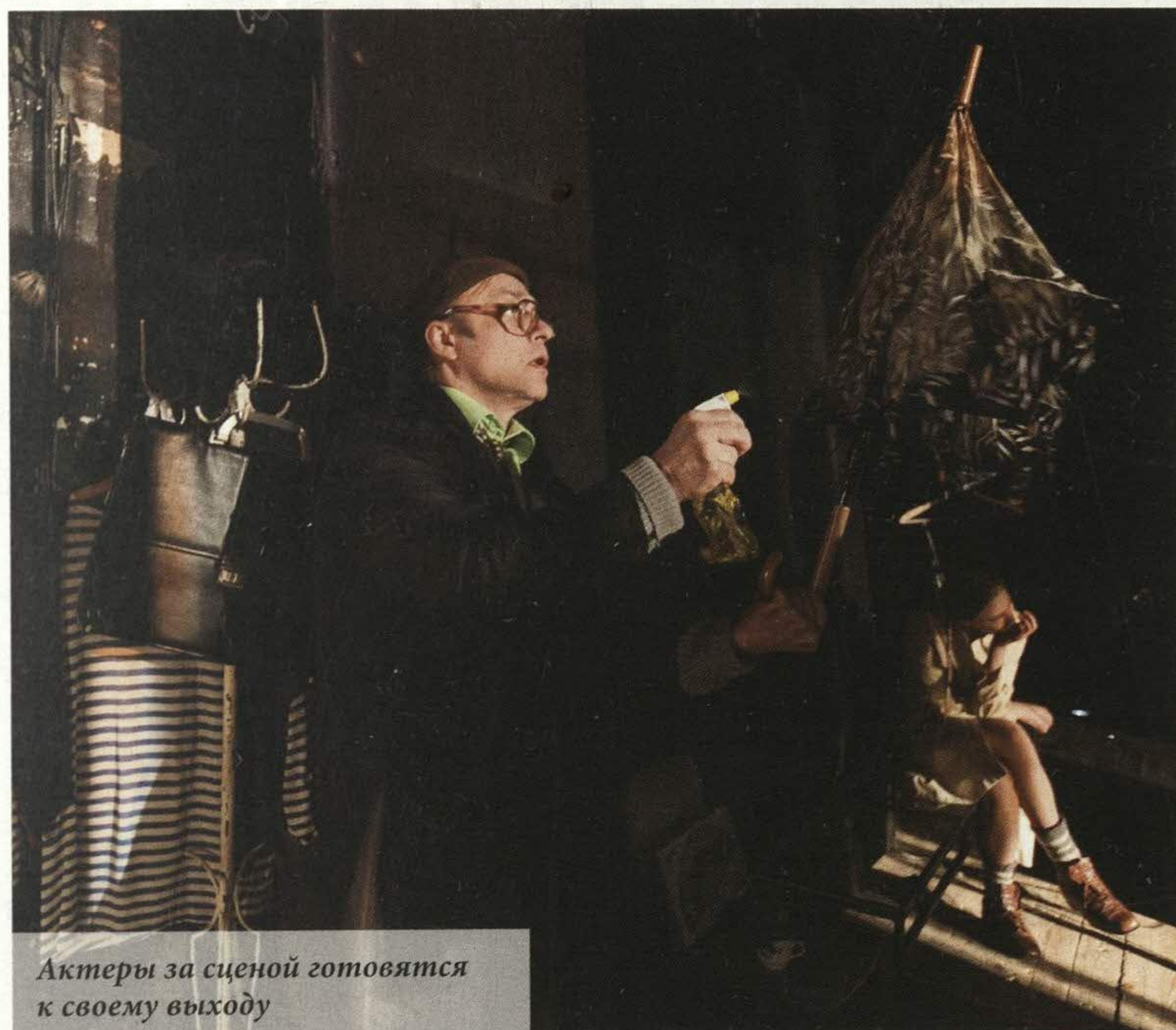
Актеры за сценой готовятся к своему выходу