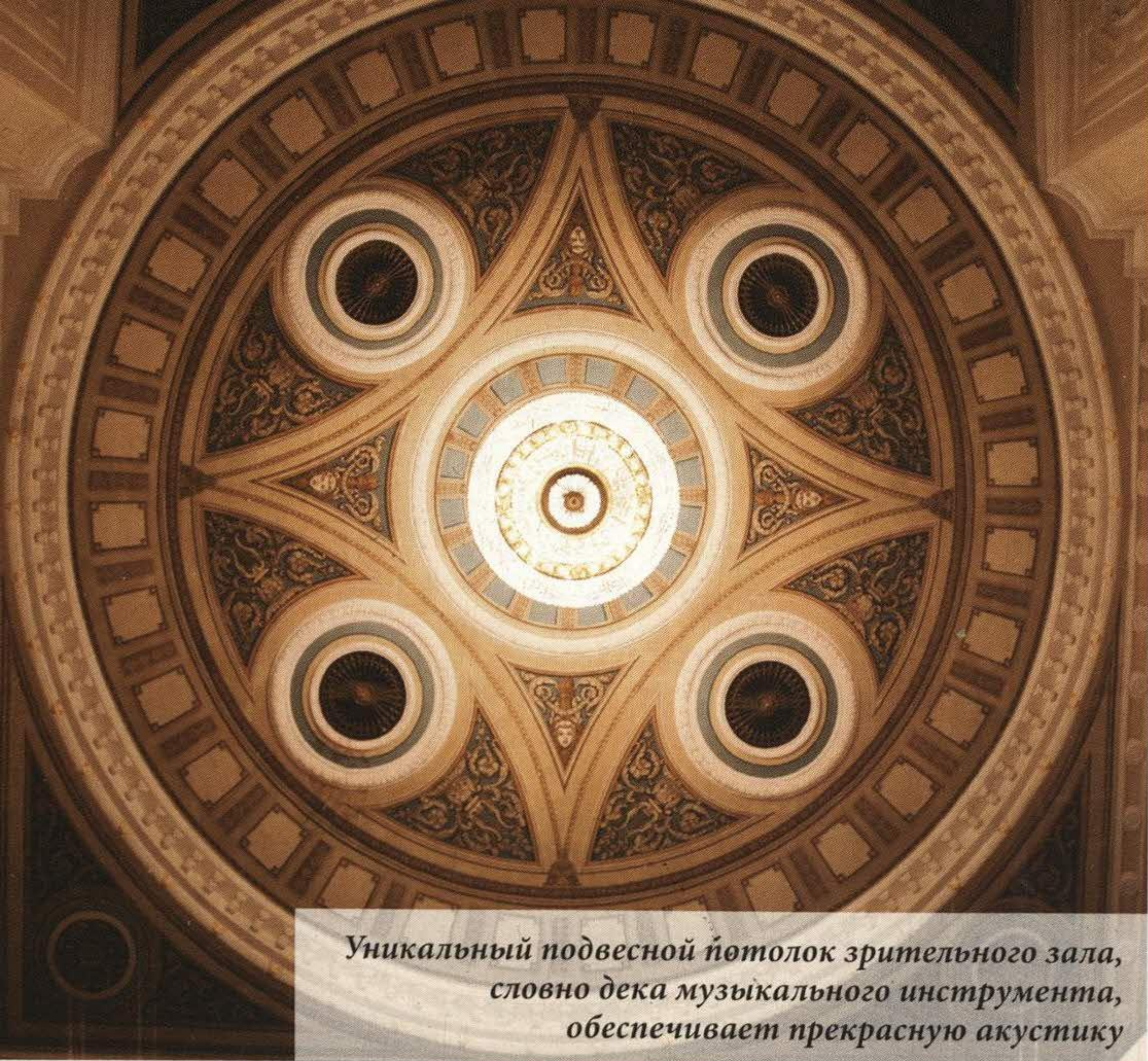
Уникальный подвесной потолок зрительного зала, словно дека музыкального инструмента, обеспечивает прекрасную акустику