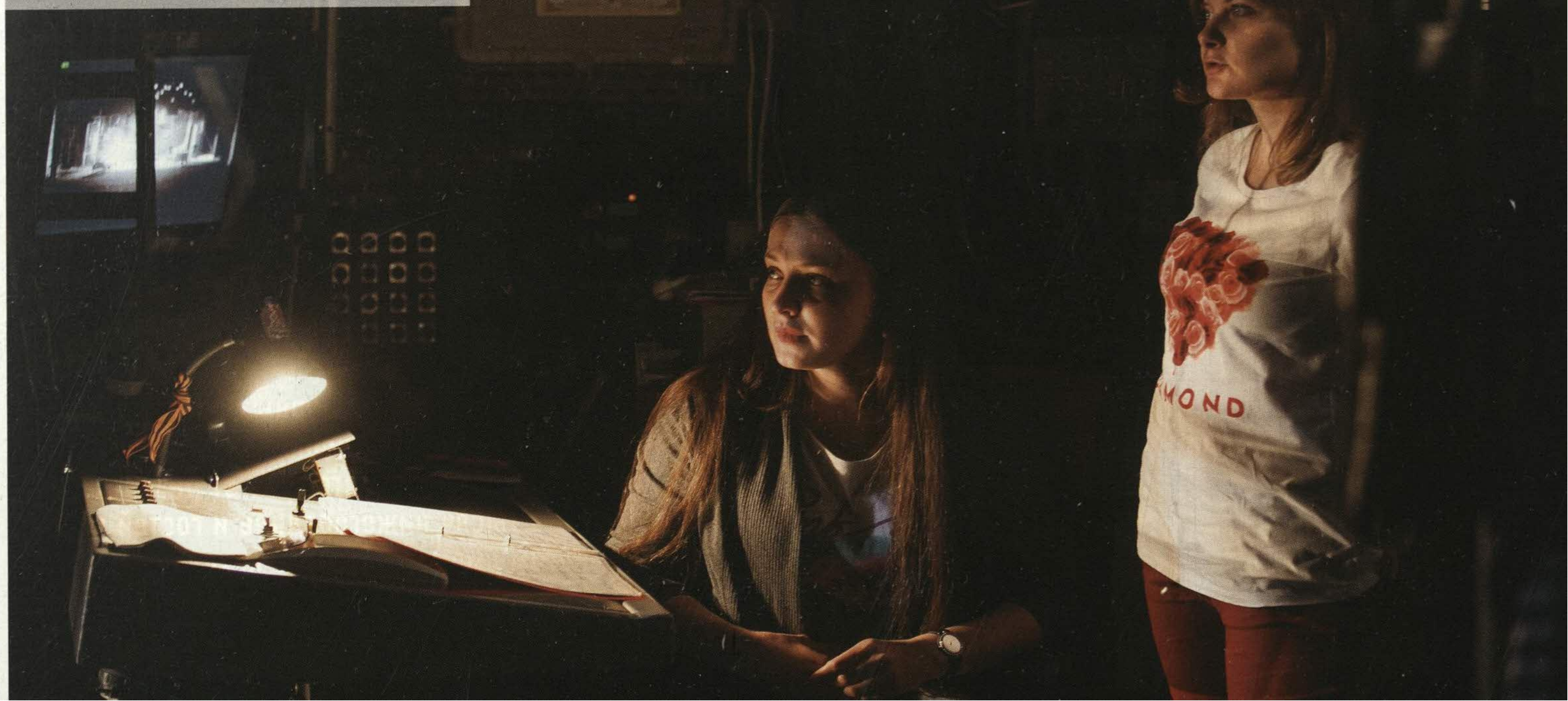
Помощник режиссера и бутафор следят за действием на сцене во время спектакля