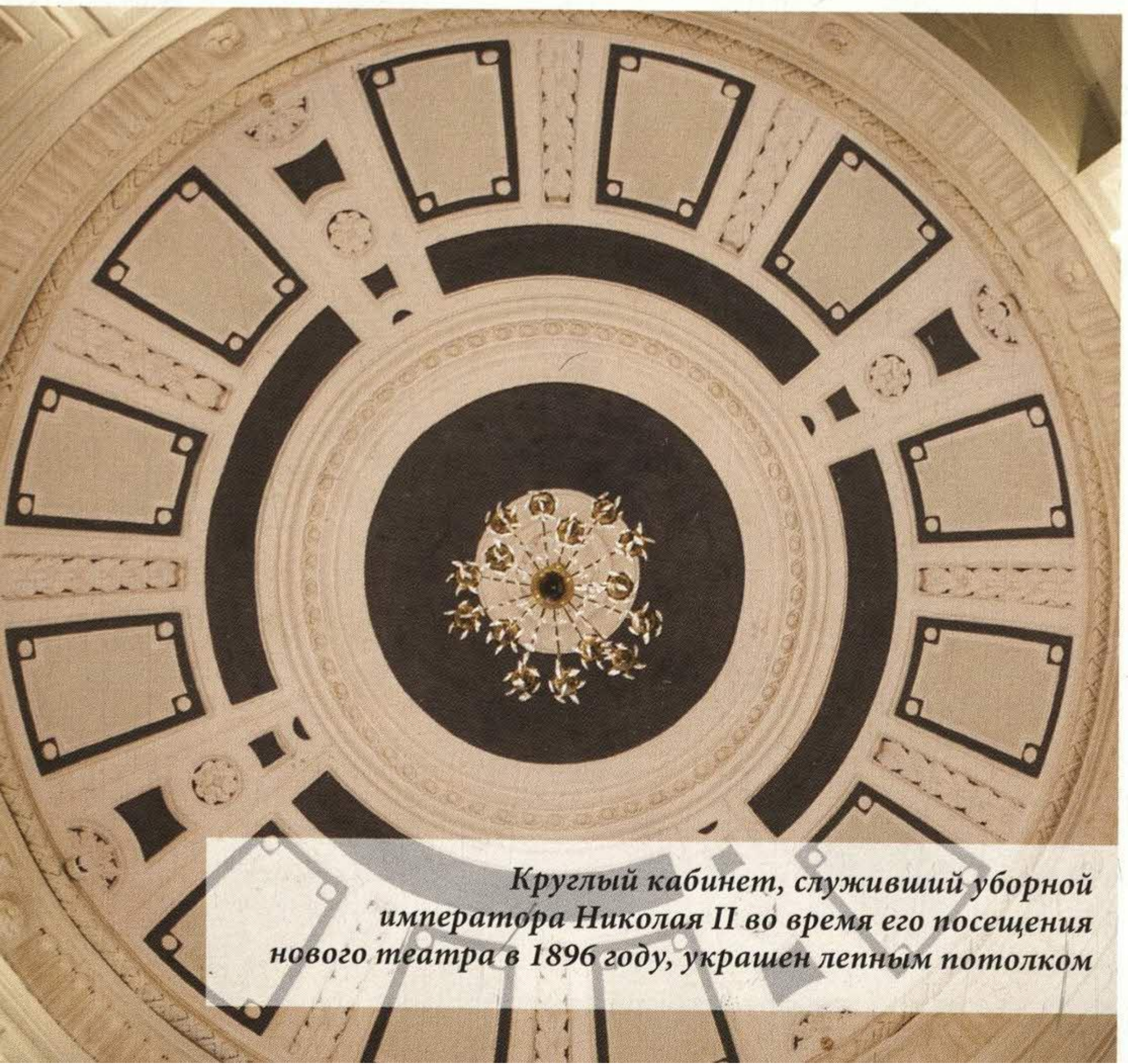
Круглый кабинет, служивший уборной императора Николая II во время его посещения нового театра в 1896 году, украшен лепным потолком