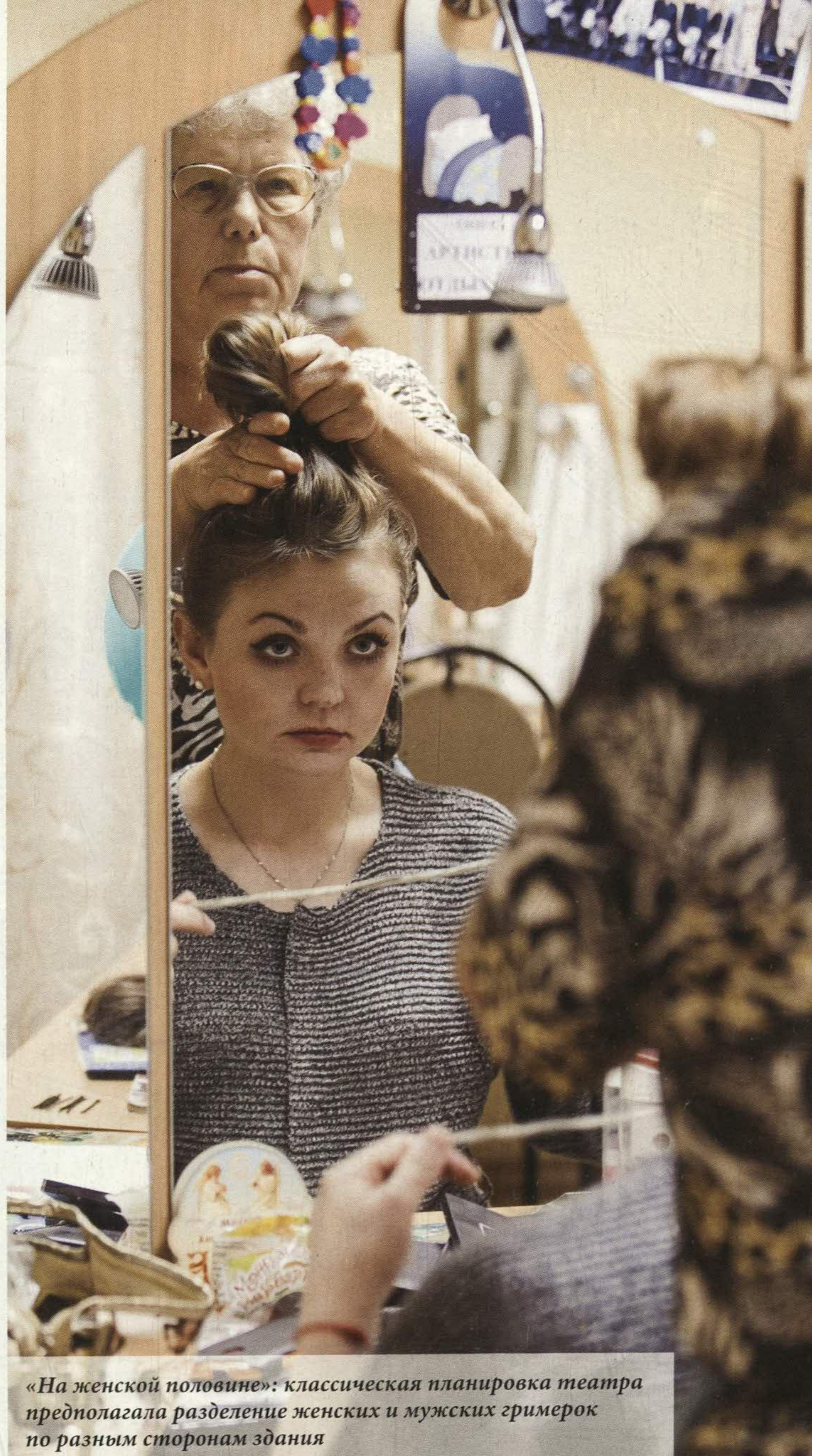
«На женской половине»: классическая планировка театра предполагала разделение женских и мужских гримерок по разным сторонам здания