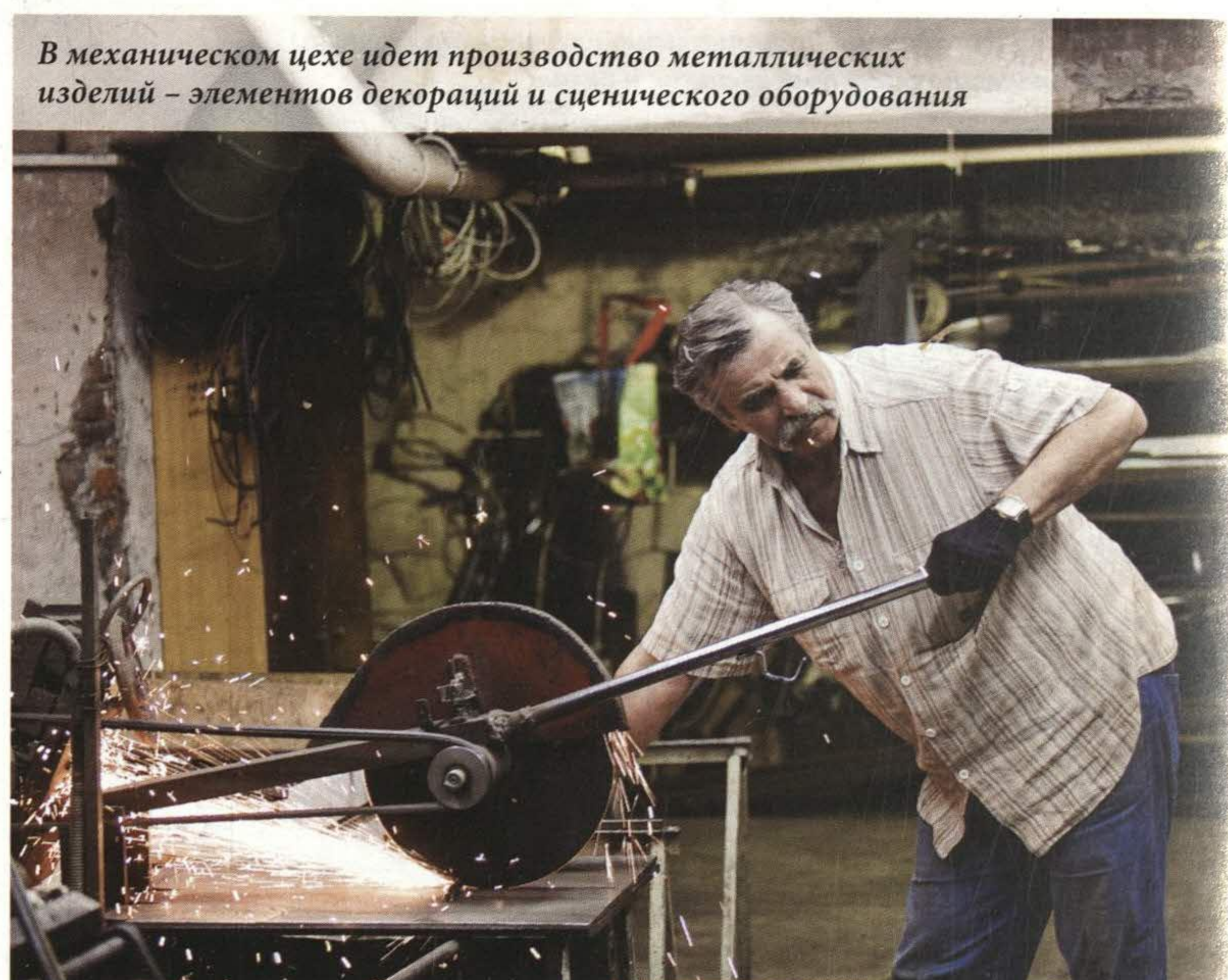
В механическом цехе идет производство металлических изделий — элементов декораций и сценического оборудования