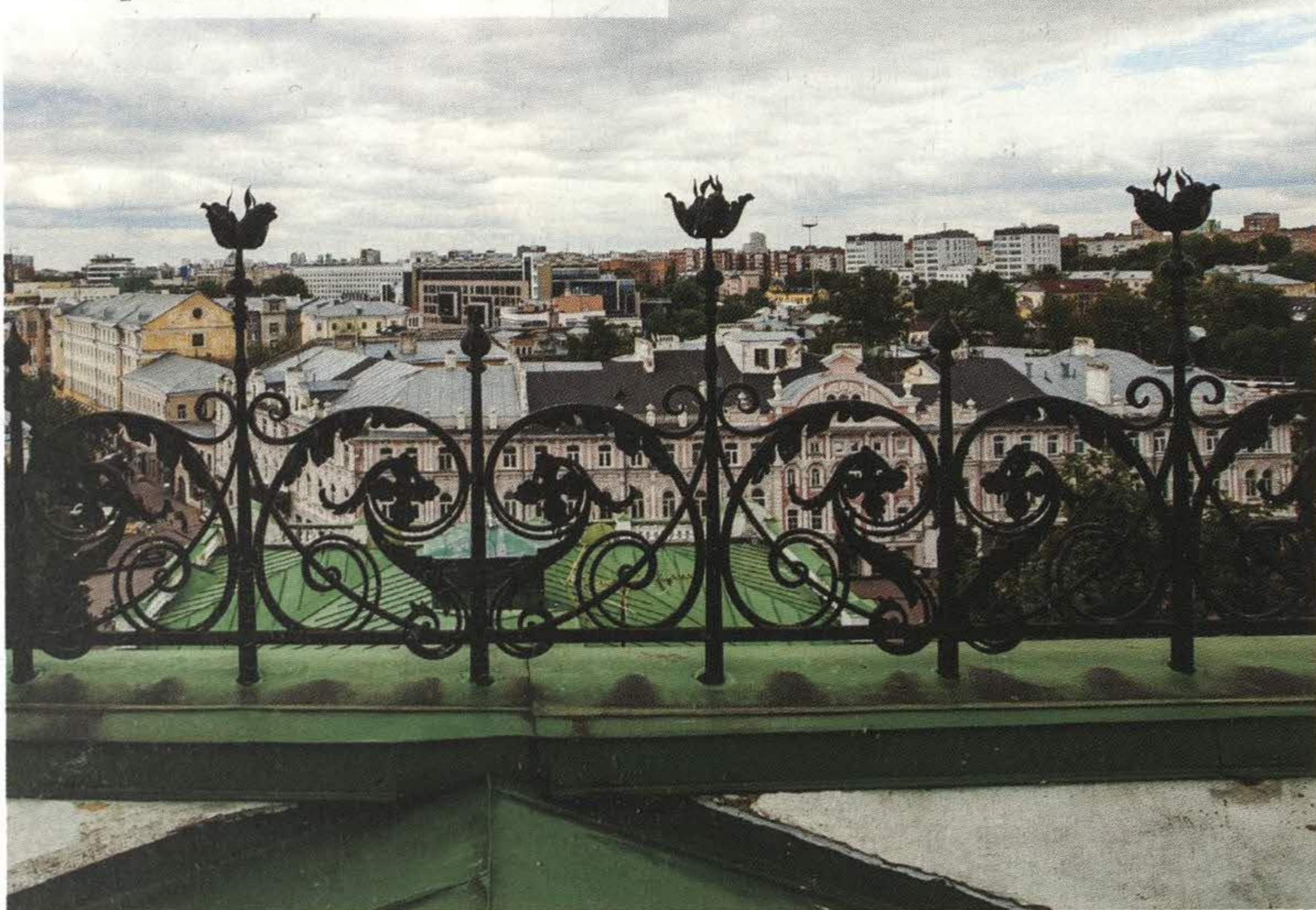
Изящная решетка венчает крышу театра над колосниками сцены