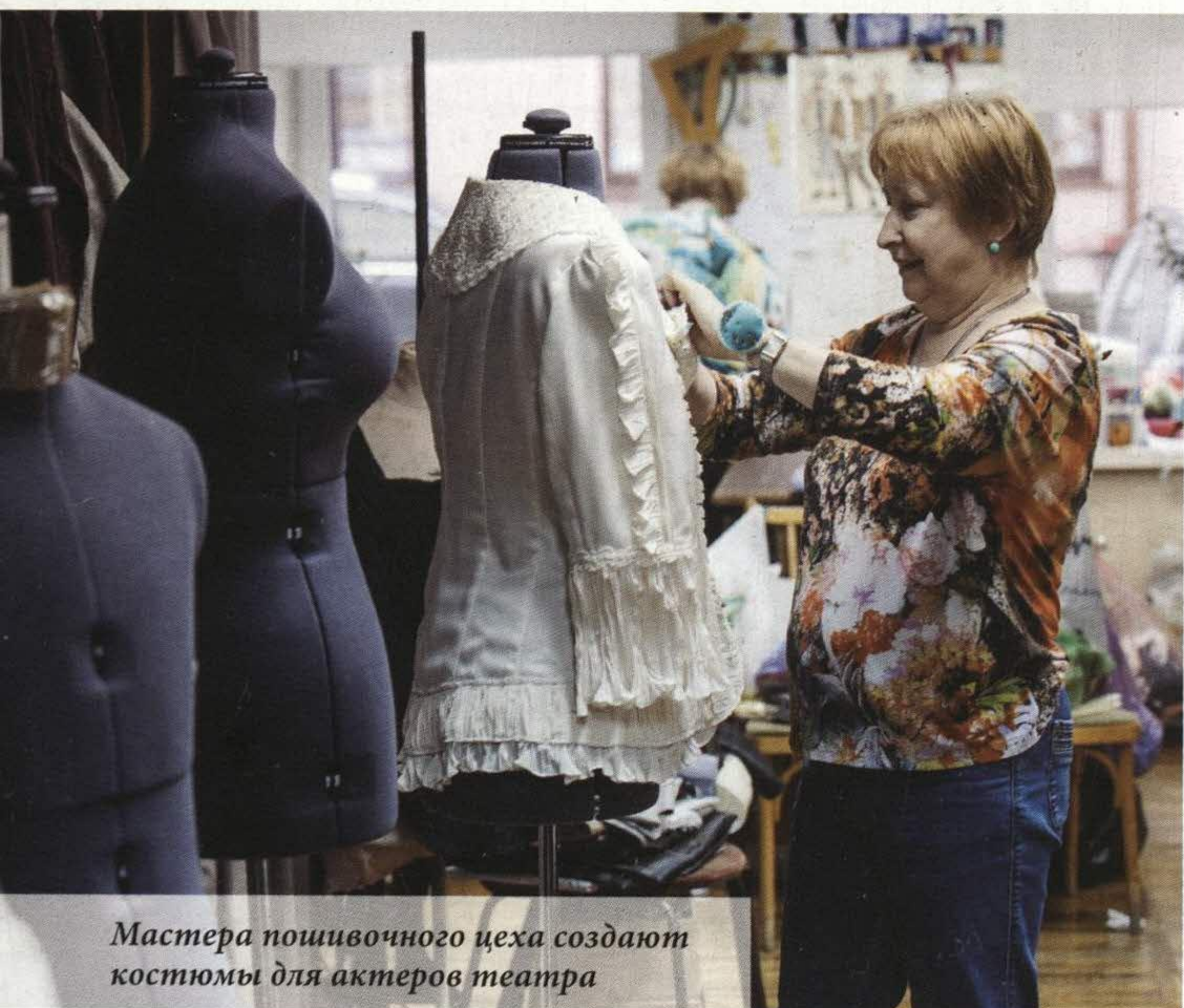
Мастера пошивочного цеха создают костюмы для актеров театра