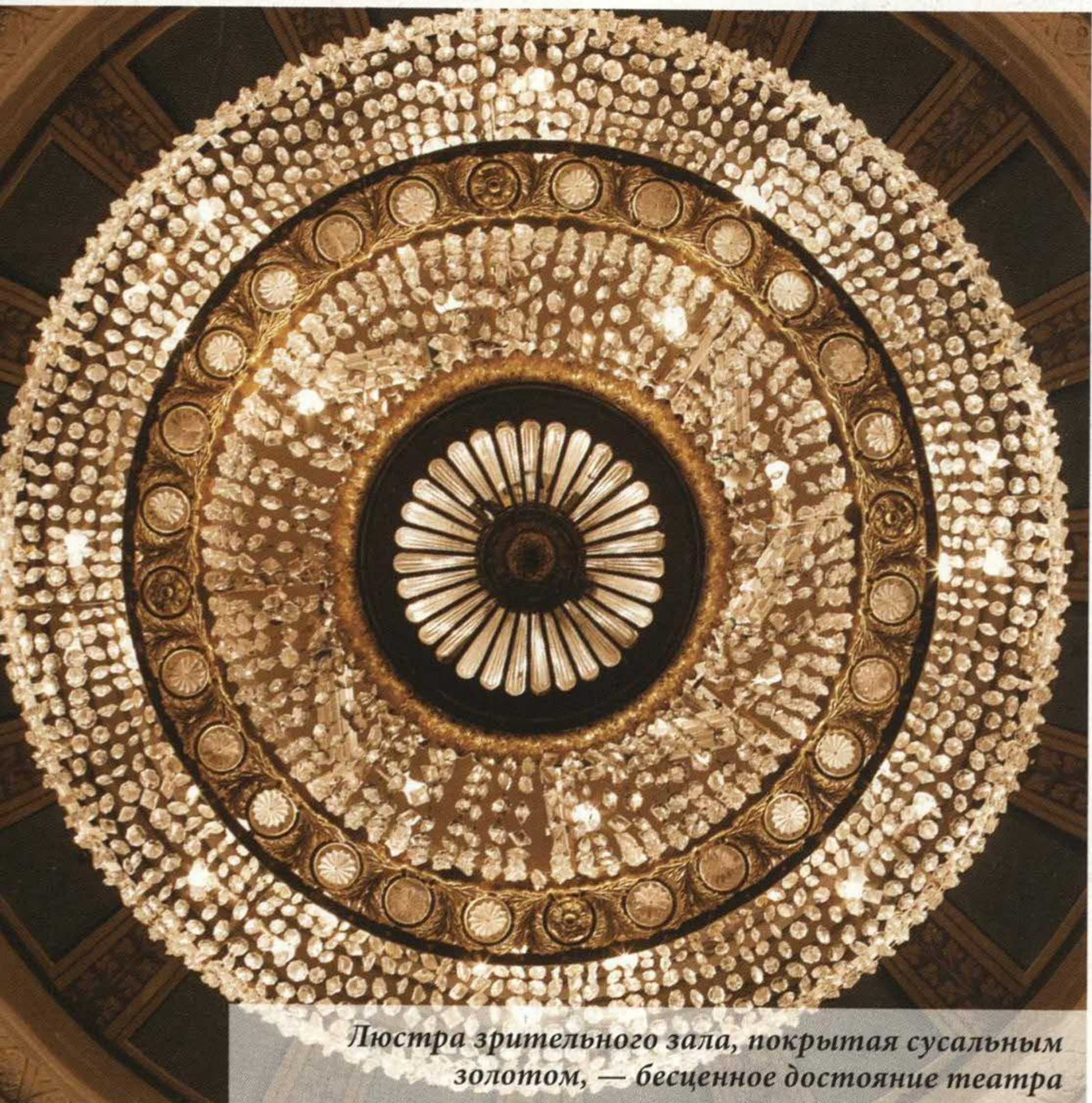
Люстра зрительного зала, покрытая сусальным золотом, — бесценное достояние театра