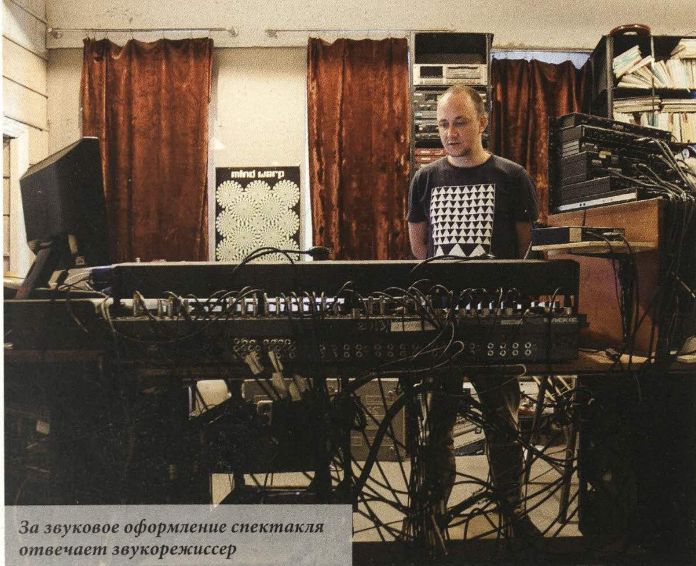
За звуковое оформление спектакля отвечает звукорежиссер