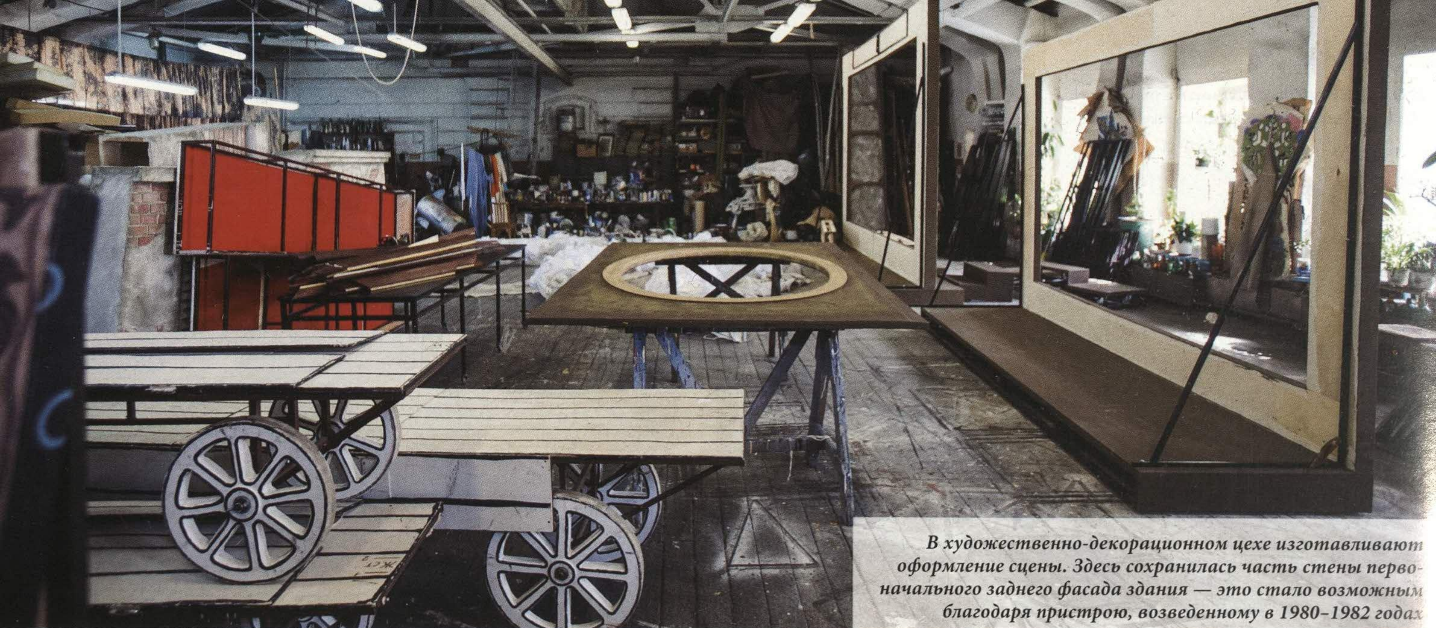
В художественно-декорационном цехе изготавливают оформление сцены. Здесь сохранилась часть стены первоначального заднего фасада здания — это стало возможным благодаря пристрою, возведенному в 1980–1982 годах