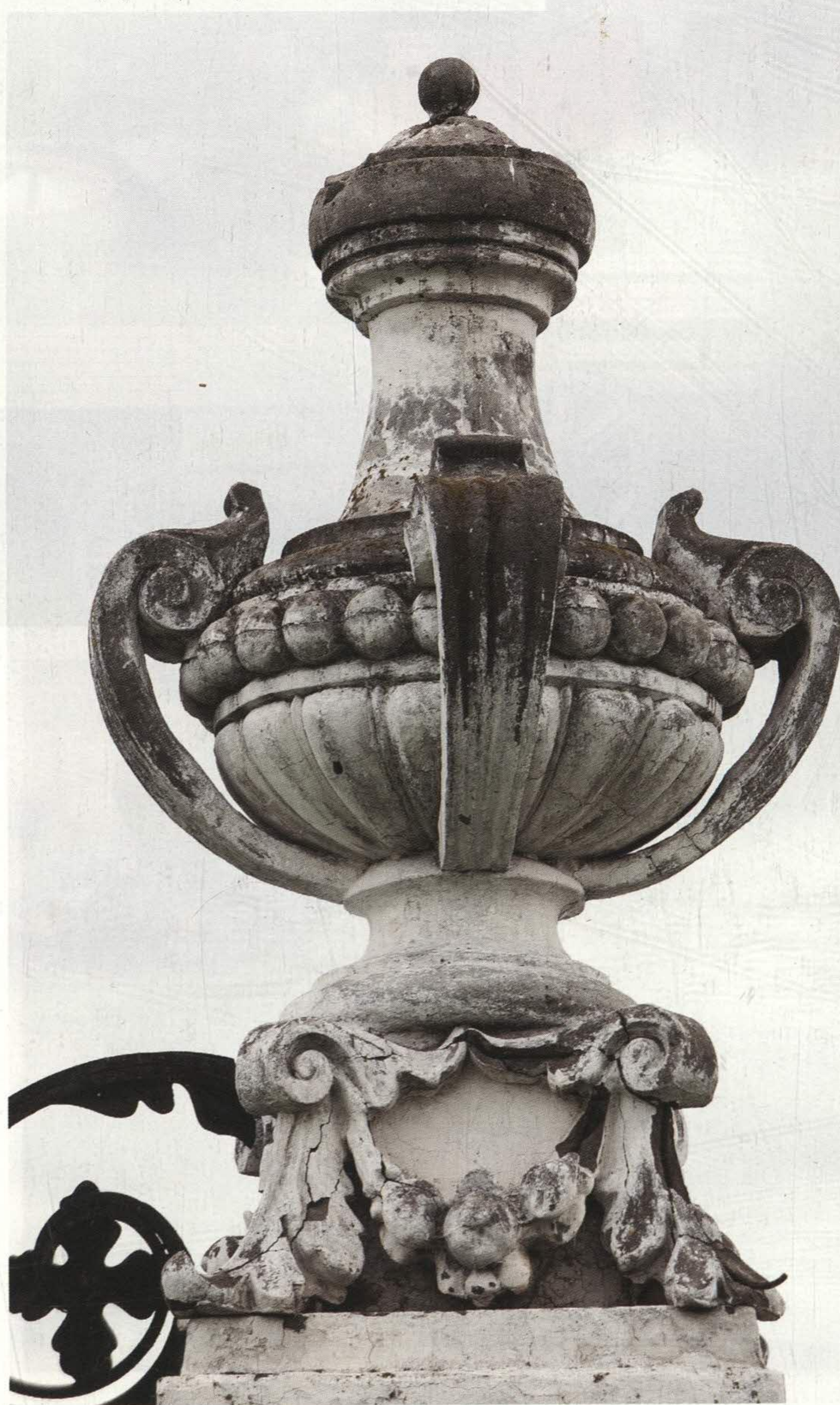
Декоративные вазоны – наиболее пышная часть убранства крыши театра