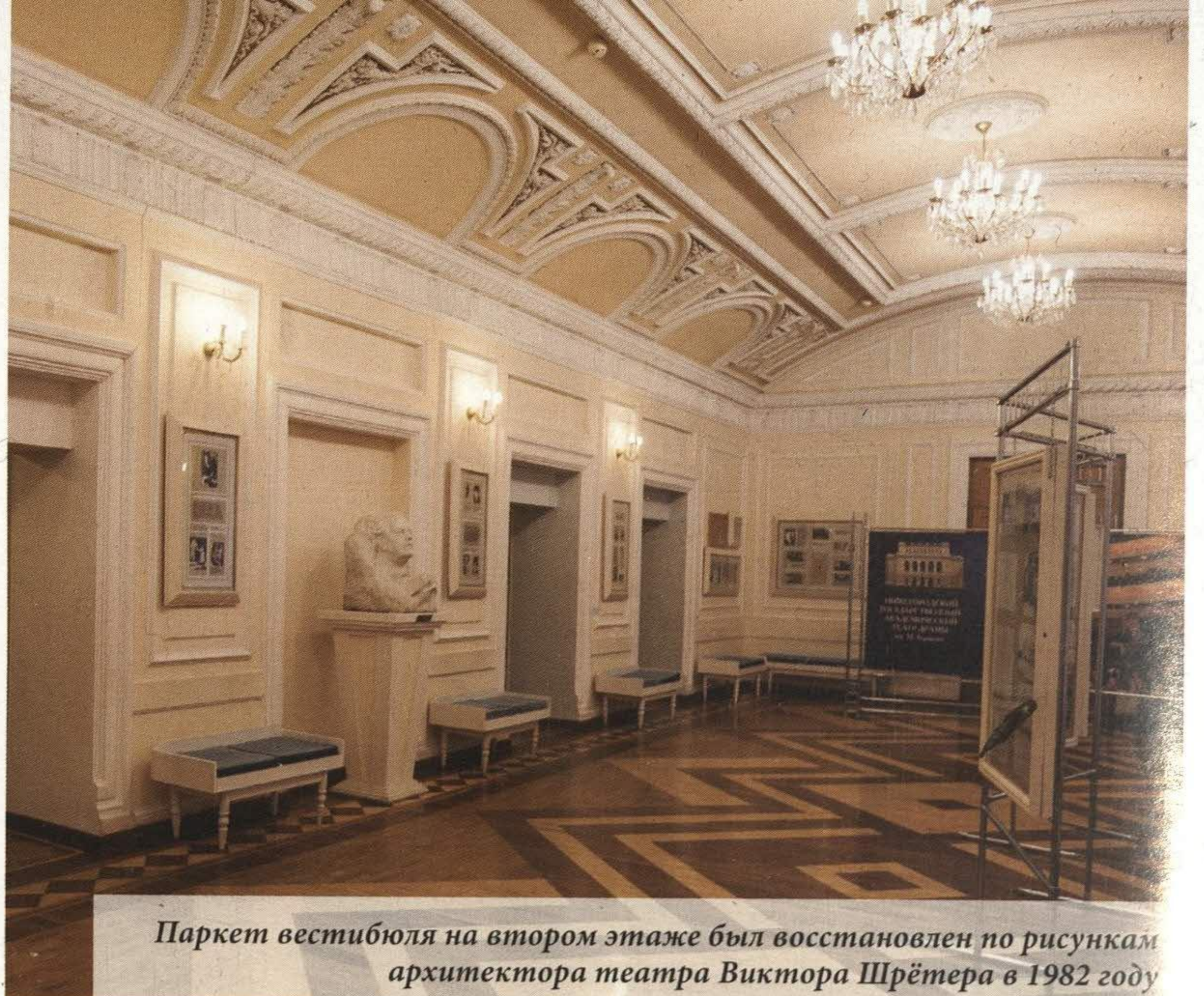
Паркет вестибюля на втором этаже был восстановлен по рисункам архитектора театра Виктора Шрётера в 1982 году