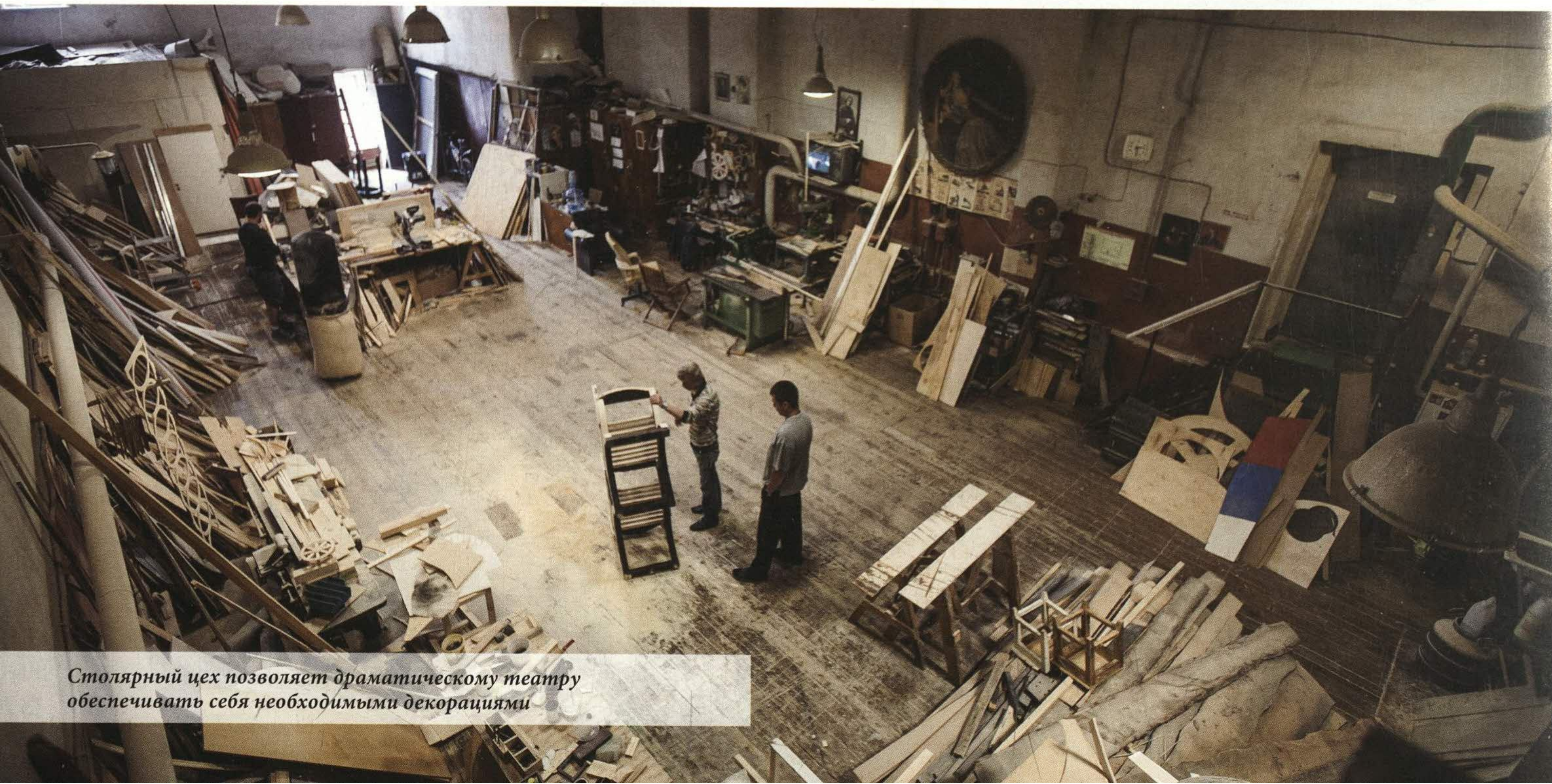
Столярный цех позволяет драматическому театру обеспечивать себя необходимыми декорациями