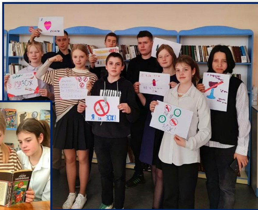
БЕСЕДА «УЧУСЬ ГОВОРИТЬ «НЕТ!»