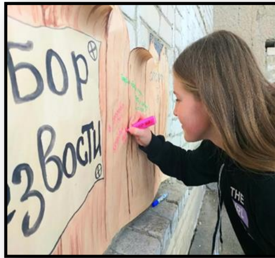
АКЦИЯ «ЗАБОР ТРЕЗВОСТИ»