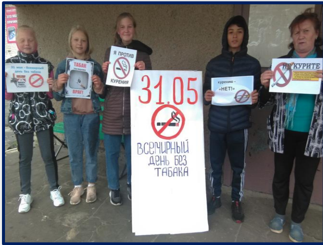
ИНФОРМАЦИОННЫЙ ЧАС «ЭТО ОПАСНО, НЕ КУРИ НАПРАСНО!»