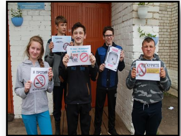
ПРОФИЛАКТИЧЕСКИЙ ЧАС «СЛОВНО ТРУБЫ НЕ ДЫМИТЕ, МЫ ВАС ПРОСИМ: НЕ КУРИТЕ!»

Международная акция «Всемирный день без табака»