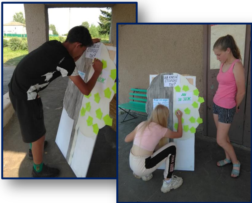
АНТИНАРКОТИЧЕСКАЯ АКЦИЯ «ДЕРЕВО ЖИЗНИ»