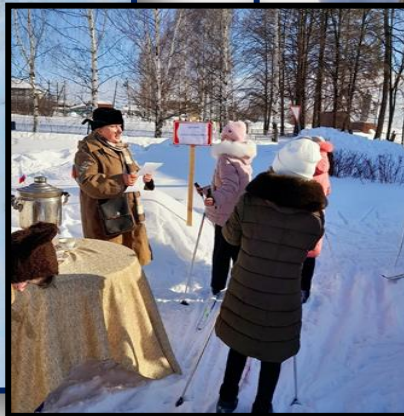
СПОРТИВНО-ИГРОВАЯ ПРОГРАММА «ЗИМНИЕ ЗАБАВЫ»